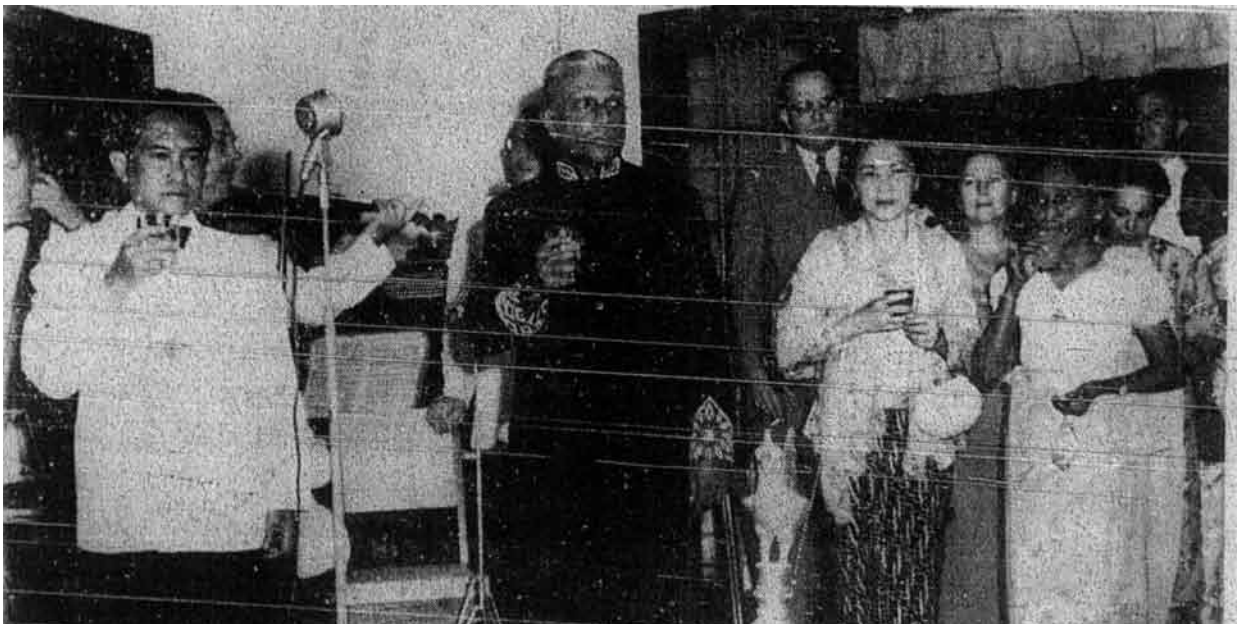
Hari kemerdekaan Ceylon telah disambut di Jakarta dengan mengadakan suatu perjumpaan oleh duta Ceylon di Indonesia dan dihadiri oleh Menteri Luar Indonesia Mister Sonario. Gambar menunjukkan tuan A.I Kunisinha duta Ceylon bersama-sama Tuan Sonario sedang minum selamat.