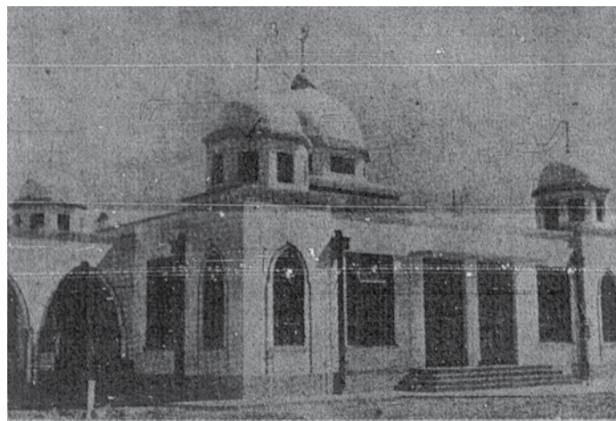
Masjid yang indah ini ialah masjid Bandar "Suria" Brunei.

afdal, sembahyang di padang atau di masjid. Imam Malik mengatakan sembahyang di padang lebih afdal kerana berpandu kepada perbuatan nabi yang sentiasa mengerjakan sembahyang aid di padang, manakala Imam Shafi'ī dan lainnya, mengatakan lebih afdal sembahyang di masjid, kerana ia memandangkan hikmatnya ialah bergantung kepada luas dan sempitnya sesebuah masjid, kalau masjid sesebuah