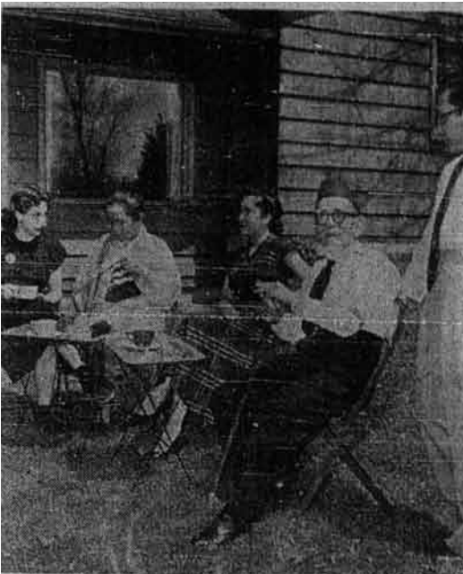
Tuan Haji Agus Salim suami isteri sedang beramah-tamah dengan sahabat handainya ketika beliau di Amerika.