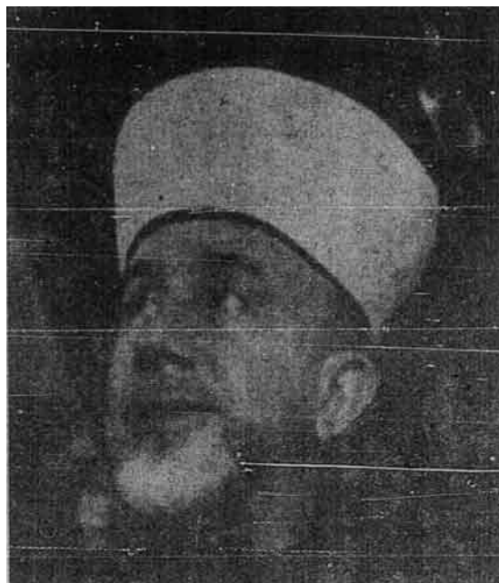
Mufti besar Palestin al-Hājj Muḥammad Amīn al-Ḥusaynī.

Ada pula yang takutkan ijtihad itu akan menimbulkan bermacam-macam fikiran dan pendapat dalam undang-undang Islam orang-orang yang takutkan itu sebenarnya bukan alim ulama. Sebab orang yang alim yang sebenar-benarnya tentulah insaf bahawa berlainan pendapat-pendapat itu adalah tanda hidup dan suburnya