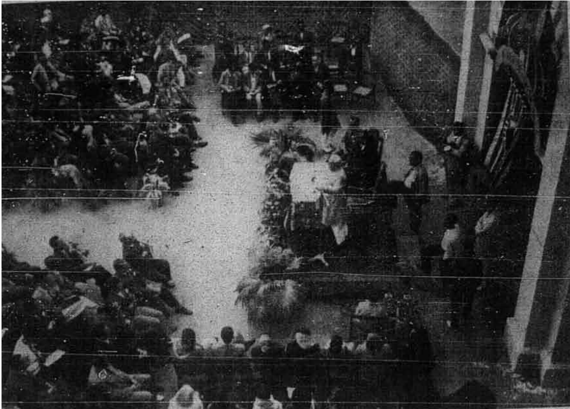
Pemandangan di Majlis Persidangan Muktamar Pemuda-pemuda Islam Sedunia

memerhati segala sesuatu di tanah air ini dengan penuh minat- sekali-sekali bergembira. Sekali pula bermenung duka.