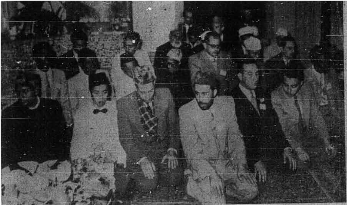
Sebahagian daripada wakil-wakil di dalam Persidangan Pemuda Islam se-Dunia sedang sembahyang apabila tiba waktu sembahyang.

Rum atau Hāji Agus Salim dan lain-lain pemimpin di Indonesia itu, dengan Hasan al-Hādī di Mesir. Jannah-Iqbal di Pakistan, atau al-Hāji Amīn al-Husīnī di Palestin . Tetapi amat kita hargai usaha-usaha pemimpin-pemimpin agama sekarang, jauh dari ingatan apakah kita atau mereka itu sendiri sedar atau tidaknya kelemahan-kelemahan itu.