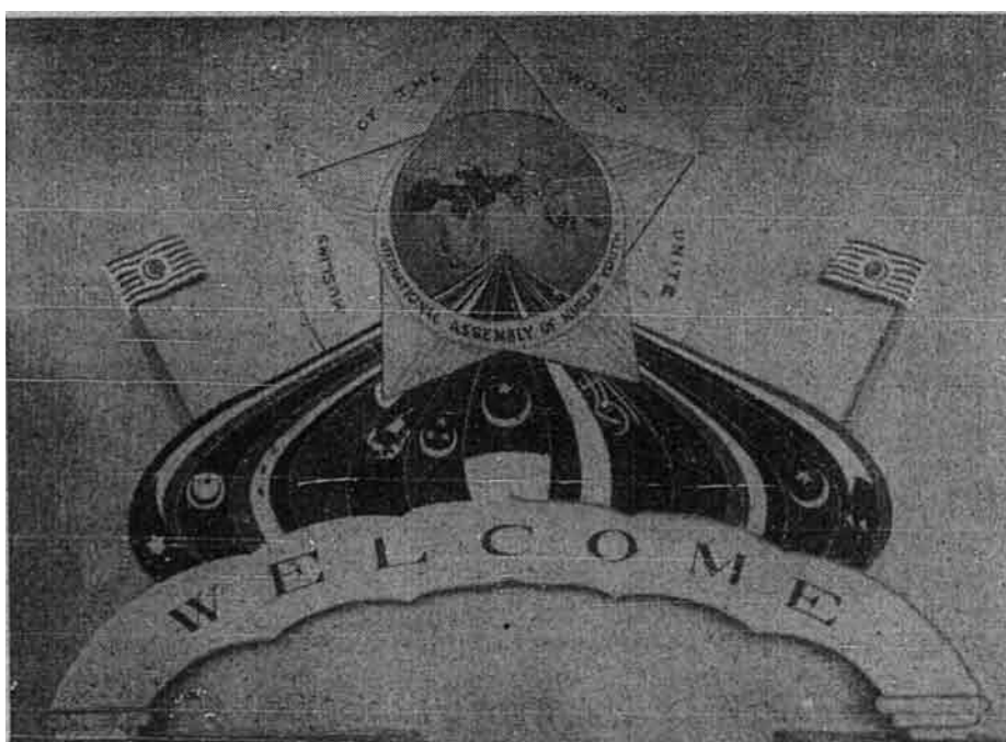
Cogan Persatuan Persidangan Pemuda Islam Sedunia (Mu'tamar Shabāb al-'Ālam al-Islāmī)

Dengan keadaan yang ada serta pandangan yang dibentuk secara negatif itu agama hanya dipandang sebagai hakim yang memberi puji dan keji kepada kelakuan hidup manusia semata. Ukuran itu dihitng atas darjat “pahala” dan “dosa” yang tiada diberi asas moral