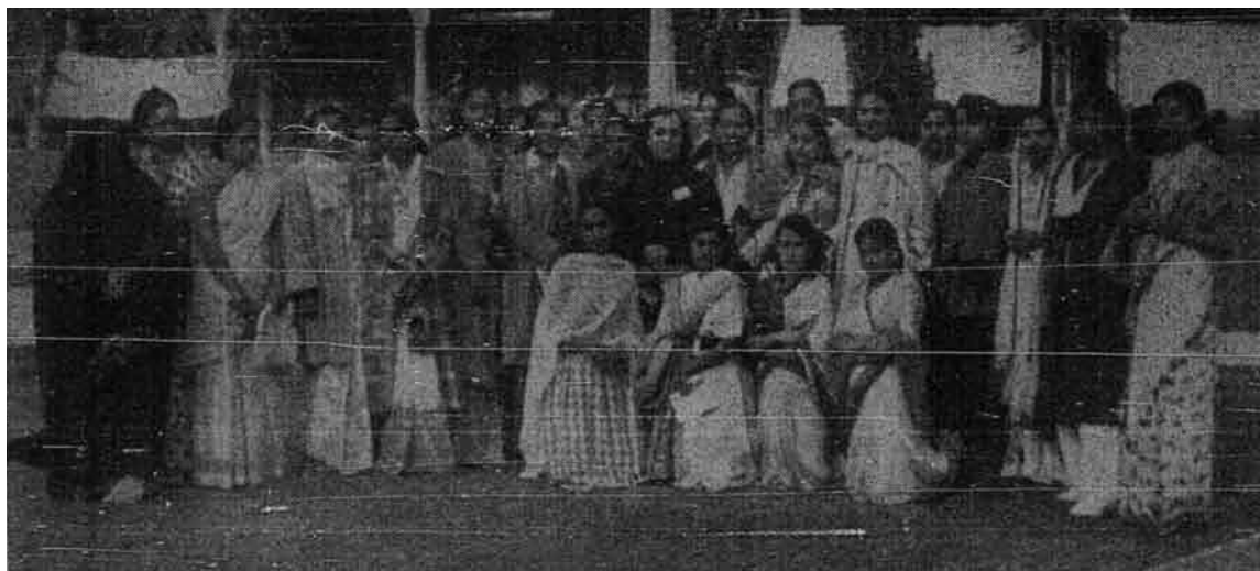
Wanita-wanita Islam yang telah menghadiri Muktamar Pemuda Islam di Karachi.

Bahasa rasmi pertubuhan ini ialah Arab dan Inggeris dan ibu pejabatnya bertempat di Karachi.