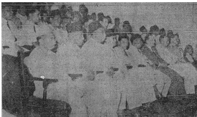
Sebahagian daripada hadirin yang telah hadir di dalam Persidangan Seruan Islam Tenggara Asia di dalam persidangan pembukaannya pada 24.12.50.

Sekarang kita masuk pula kepada masalah yang kedua berkenaan dengan keadaan seruan Islam. Seruan Islam ini sebenarnya adalah sangat mustahak dan sangat perlu kepada binaan yang kuat dan bermakna. Seruan-seruan itu tidak akan berjaya dengan hanya di atas namanya sahaja tetapi tidak di dalam pekerjaannya. Kita tidak boleh menyeru atau kita tidak mesti mengadakan seruan kepada orang lain sebelum orang-orang kita dapat disempurnakan keadaannya kerana dengan kita hanya menyeru kepada orang yang bukan Islam tetapi kita tidak mengadakan binaan atau mengadakan seruan membetulkan orang-orang kita maka