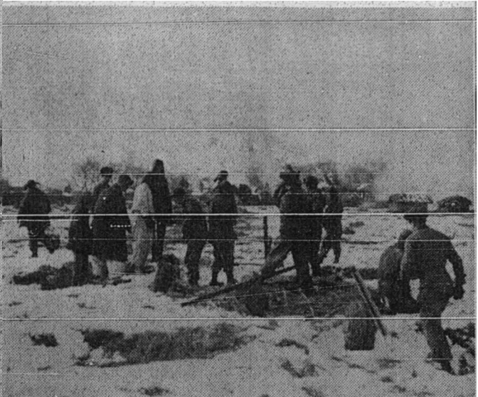
Askar-askar Amerika di dalam salji yang tebal itu sedang sibuk membuat pertahanan-pertahanan dengan kawat berduri tatkala mereka undur daripada serangan-serangan komunis China.