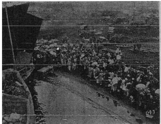
Masalah orang awam adalah sesuatu peperangan itu ialah suatu masalah yang payah diselenggarakan. Dalam gambar ini kelihatan orang-orang berpindahan (mengungsi) sedang turun di sebuah kapal dari pelabuhan Hongnam