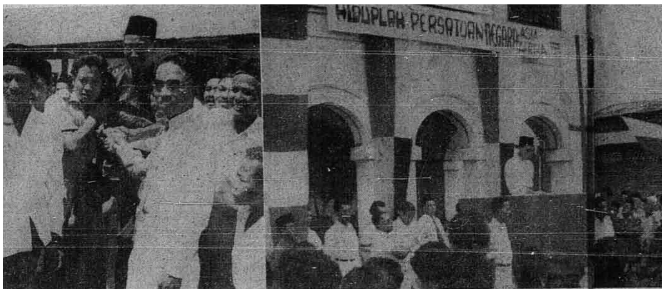
Sebahagian daripada peminat-peminat yang hadir dalam Rapat Raksasa menyambut Doktor Burhānuddīn.

Rapat Raksasa dan di kanan sekali Doktor Burhānuddīn sedang disambut apabila tiba di Rapat itu.