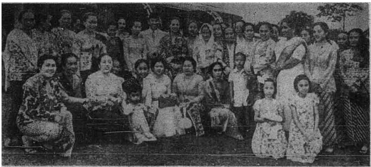
Hartini dan Presiden Sukarno bersama-sama dengan wanita-wanita di hadapan rumah tempat tinggalnya, "De Villa Arjuna" di Ciumbuleuit di Bandung.