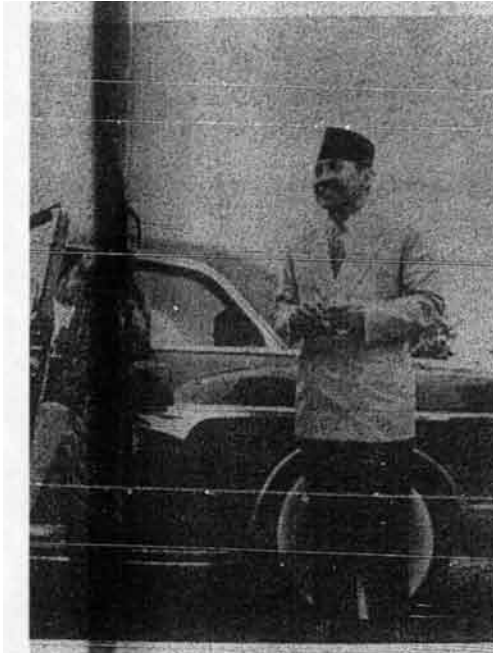
Bandung. Ia berpakaian preman.

Presiden Sukarno membawa Hartini ke Bandung baharu-baharu ini dan membawanya ke tengah-tengah masyarakat – bantahan timbul lagi. Perhatikanlah Sukarno bersama-sama Hartini di Bandung