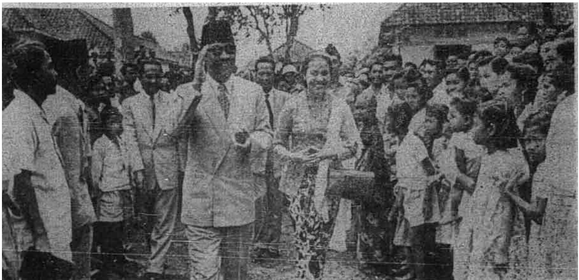
Presiden Sukarno ketika hendak melawat mertuanya di Jalan Anggerik di Bandung.