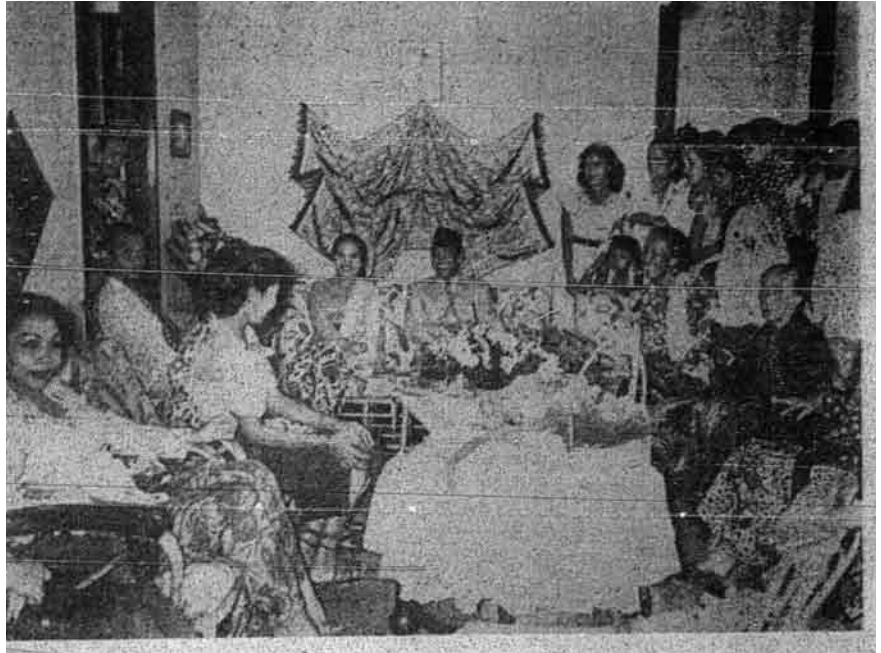
Presiden Sukarno bersama-sama Hartini dikerumuni oleh wanita-wanita di rumah mertuanya di Jalan Anggerik di Bandung.