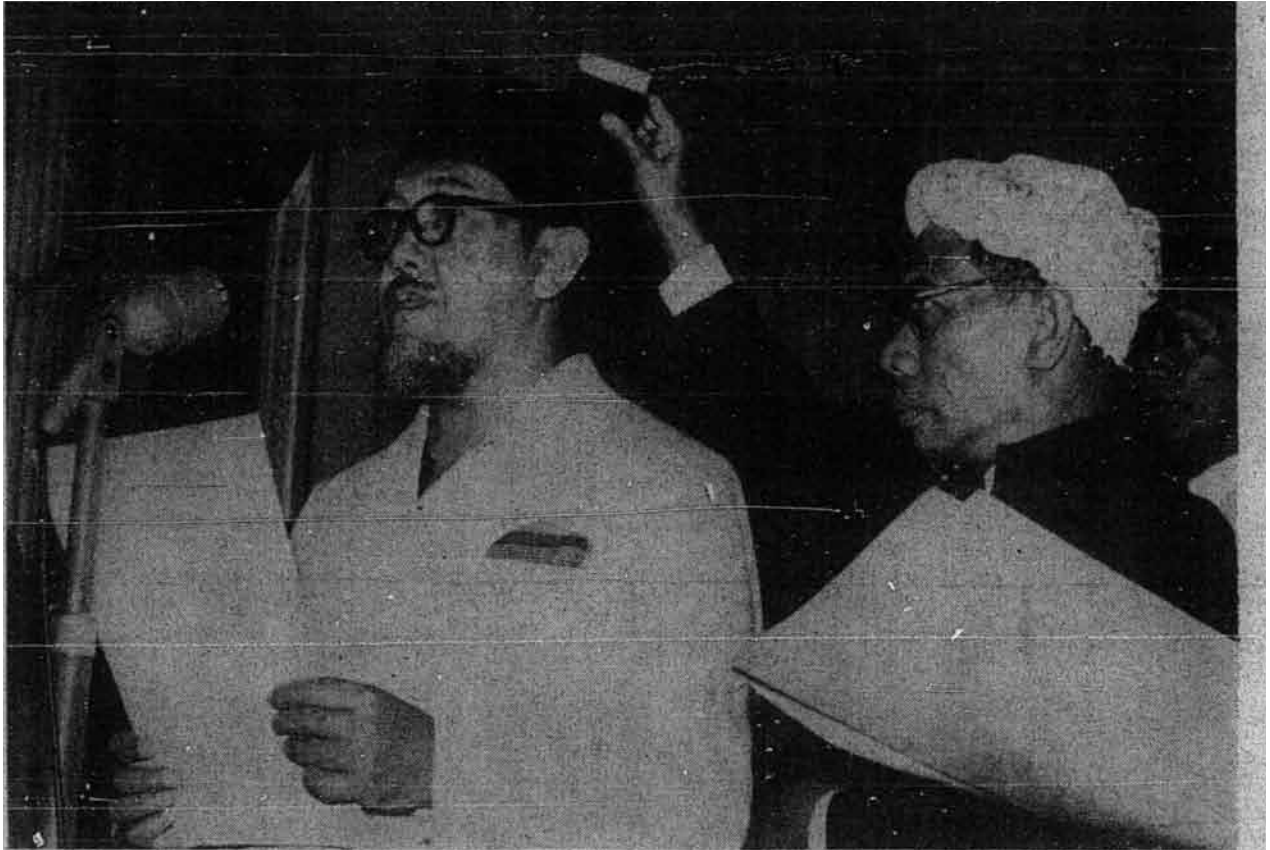
Perdana Menteri Ali Sastroamijoyo sedang bersumpah

Jemaah Menteri Indonesia yang baharu telah dilantik iaitu jemaah menteri yang dilantik oleh pemilihan umum di Indonesia. Setelah Ahli-ahli Jemaah Menteri itu disetujui maka mereka telah diminta bersumpah tetapi malangnya cara bersumpah itu masih cara penjajahan – tidak mengikut cara sumpah Islam yang dituntut.