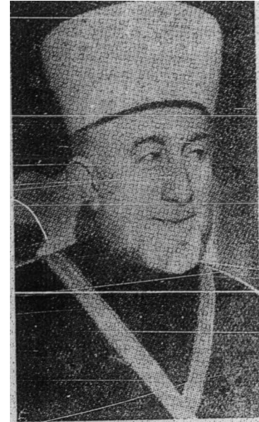
Sahib As-Samahah Al-Haji Amin Al-Husseini Mufti Palestin Pengerusi Muktamar Al-'Alam Al-Islami

Di bawah ini kita peturunkan ucapan Sahib As-Samahah Al-Haji Amin Al-Husseini Mufti Besar Palestin sebagai Pengerusi Persidangan Muktamar al-'Alam Al-Islami yang diadakan di Karachi pada 9 Februari 1951 di dalam mana beliau telah mengadakan seruan supaya umat Islam bekerja keras mencapai kesatuan Islam menurut perintah Allah iaitu: "Bangsa ini hanya sanya satu sahaja." Beliau menyebut juga di dalam ucapannya itu tujuh fasal yang sangat mustahak yang patut dikaji oleh tiap-tiap sendi masyarakat Islam bagi mencapai tujuan-tujuan yang utama untuk membaiki dan menghalusi perihal dan kedudukannya pada masa yang akan datang supaya Islam bangkit semula yang akan membawa keadilan di dalam serba-serbi maknanya dengan tidak syak lagi. Perhatilah ucapan beliau yang dipeturunkan di bawah ini dengan saksama mudah-mudahan memberi manfaat kepada kita:-