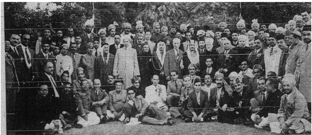
Wakil-wakil bergambar di halaman istana Liquat Ali Khan Perdana Menteri Pakistan.