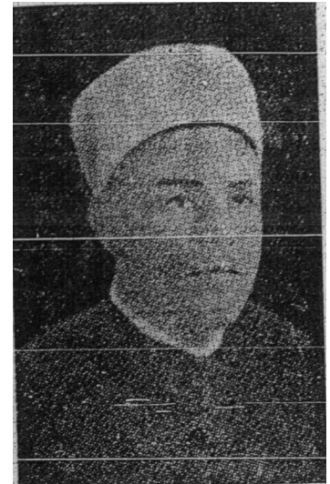
Dr Mustafa As-Sabai

Kesatuan kita tidak dimaksudkan hendak mengulangi tawarikh-tawarikh kebuasan yang di tanggung oleh Hyderabad kesatuan kita hendak dimaksudkan hendak melakukan perbuatan-perbuatan kecerobohan seperti yang telah berlaku ke atas Kashmir. Kesatuan kita adalah dikehendaki supaya kita dapat menghuraikan suatu masalah yang bersimpul-simpul seperti Kashmir yang tidak dapat dihuraikan oleh orang-orang yang bertanggungjawab kerananya dan yang kewajipannya ialah menghuraikan masalah itu. Kesatuan kita tidak dimaksudkan hendak mengulangi kemalangan yang telah berlaku atas Magribi al-Fadz (Morocco)