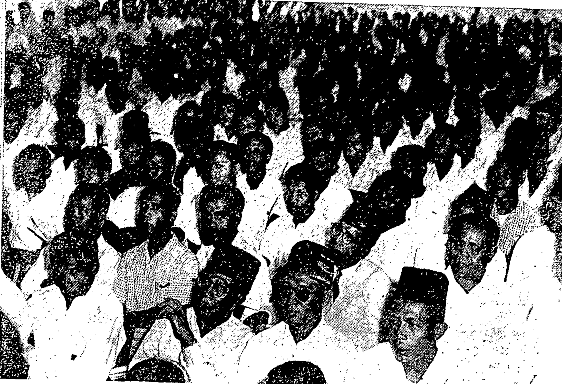
Sebahagian hadirin dalam rapat umum parti Rakyat Singapura.