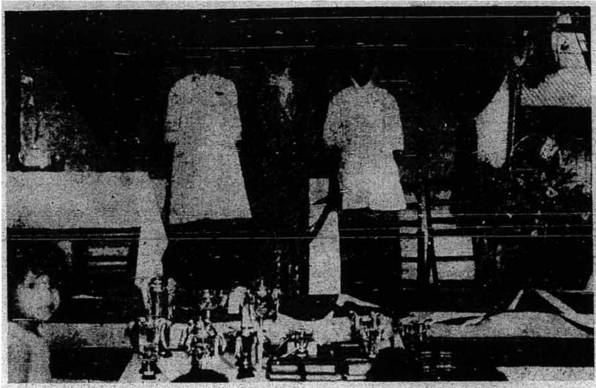
Tiga pemudi yang telah berjaya dalam Peraduan Membaca Quran, anjuran Persatuan Kebajikan Kaum Tani, Kebun Ubi, Geylang, Singapura, baharu-baharu ini.