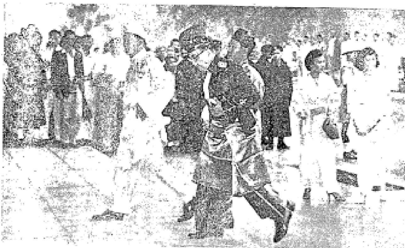
Yang Maha Mulia Sultan Selangor sedang menuju Istana Negara. Di kiri baginda kelihatan Yang Berhormat Datuk Abdul Razak Menteri Pertahanan.