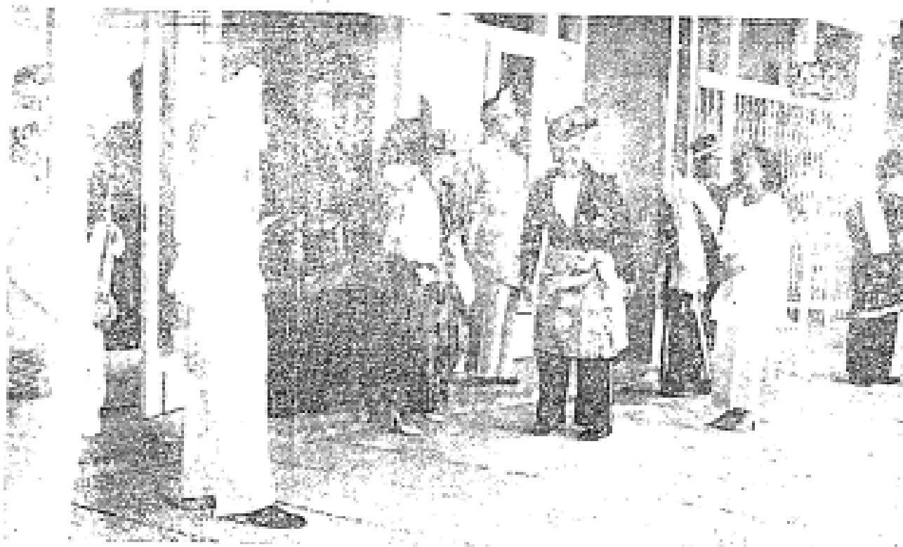
Duli-duli Yang Maha Mulia Raja-raja Melayu sedang menunggu sampainya angkatan Seri Paduka Yang di-Pertuan Agong pada hari baginda ditabalkan.