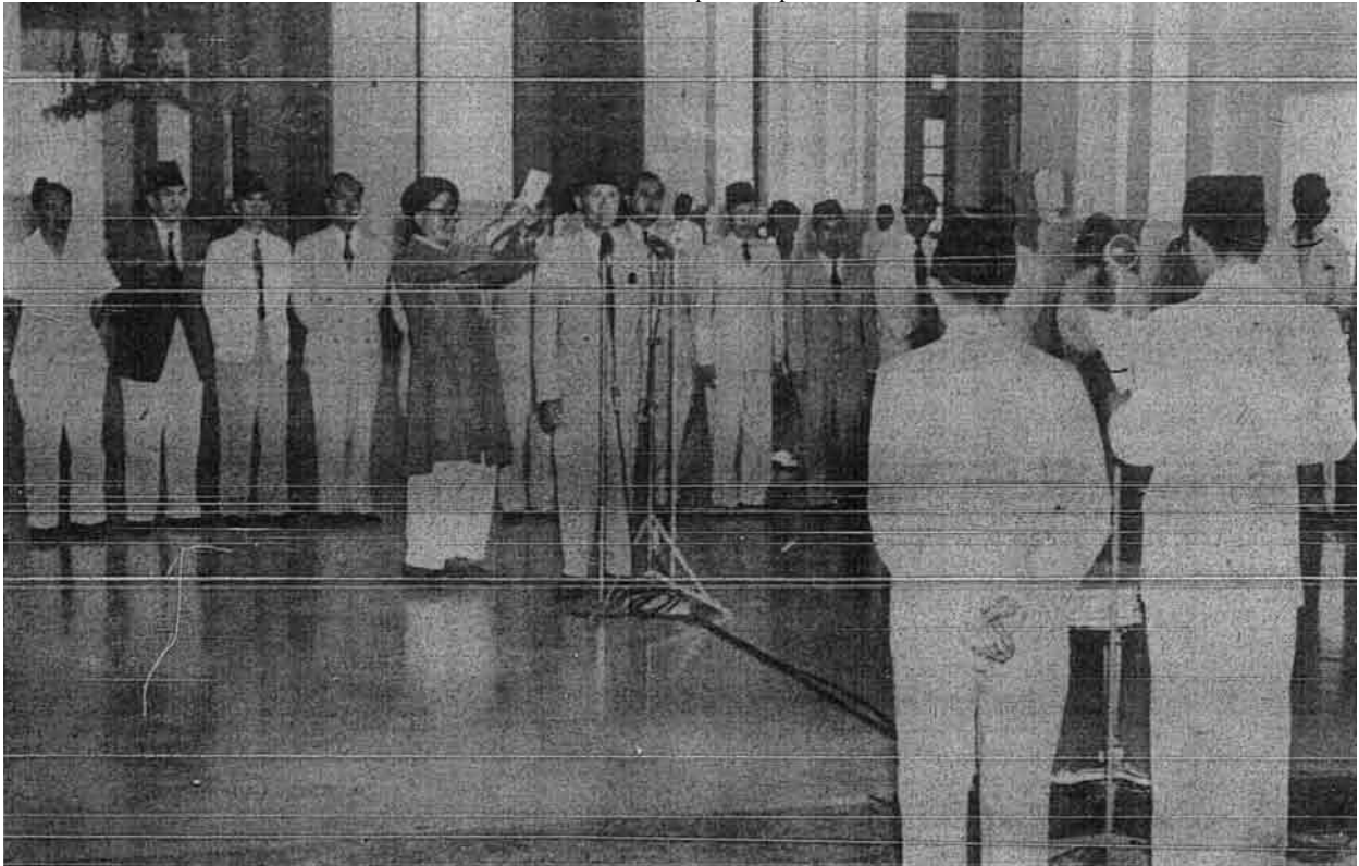
Gambar menunjukkan Dr Sukiman sedang bersumpah di hadapan Presiden Sukarno dan wakil Presiden Dr Mohammad Hatta nampaknya cara sumpah yang dilakukan ialah meletakkan Quran sebagai "saksi" di sebelahnya itu masih mengikut sumpah cara penjajahan Belanda dahulu – pada hal sumpah cara Islam lain daripada itu.

Sesudah Presiden Sukarno mengisytiharkan nama-nama Jemaah Menteri Dr Sukiman pada penghujung bulan April yang lalu maka suatu istiadat bersumpah setia pun diadakan.