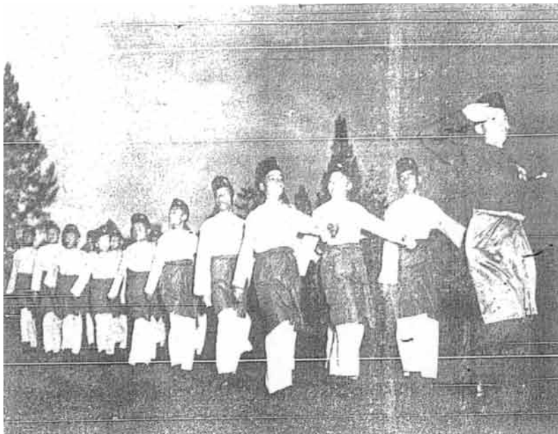
Sebahagian daripada kadet-kadet yang dilatih iaitu daripada kebanyakan daripada Orang-orang yang dilatih daripada kecilnya supaya menjadi orang-orang polis yang mahir dan tahu adab sopan santun di dalam pergaulan orang ramai – Gambar Singapura Standard.