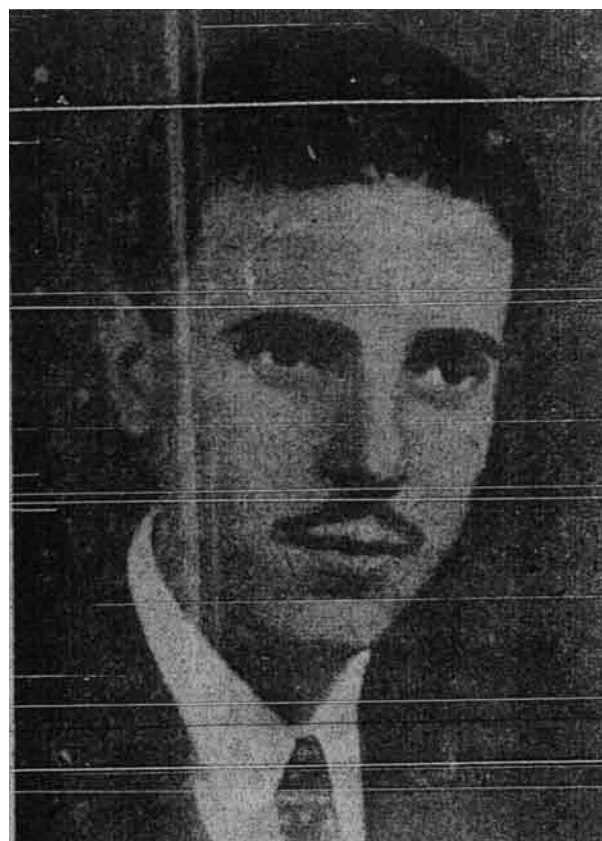
Mustafa Syukri A'shu pembunuh Al-Malik Abdullah.

Palestin Timur yang ditawan oleh tenteranya telah disatukan dengan kerajaan Sharq Al-Ardan. Al-Malik Abdullah telah meninggal sebelum sampai cita-citanya yang besar untuk mendirikan Suria Al-Kubra – menggabungkan Lubnan, Syria, Ardan dan Palestin menjadi sebuah kerajaan. Cita-cita itu belum tercapai dan untuk merancangkan tujuan-tujuan yang tersebut maka sesudah Palestin dibelah bagi ia menghendaki supaya kerajaannya mendapat suatu tanah untuk sebuah pelabuhannya di pantai laut Mediteranean supaya ia mudah menerima bantuan-bantuan daripada kuasa-kuasa Barat yang sangat dijulangnya tinggi itu dengan tidak lagi melalui terusan Suez dan dengan kerana tujuan-tujuan itu ia telah menerima tawaran perdamaian dengan Yahudi yang telah bertapak itu. Oleh kerana cita-citanya tidak akan sampai kalau dimintanya dengan kerajaan-kerajaan Arab yang sebahagian besarnya berjuang dengan tulus ikhlas di dalam Palestin tidak untuk maslahat kerajaan mereka masing-masing – hanya semata-mata untuk jihad pada jalan Allah yang dituntut mereka itu menjalankannya.