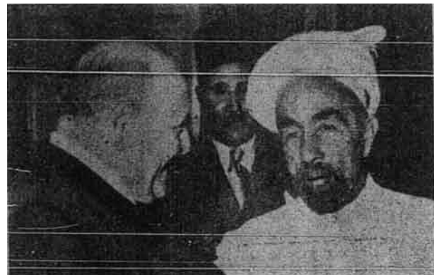
Almarhum Al-Malik Abdullah di sambut oleh Basharah Al-Huri ketua negara Lubnan di Perhentian Kapal Terbang Beirut dalam masa lawatannya yang akhir ke negeri itu.

Oleh kerana pembunuhannya itu dikatakan seorang daripada angkatan pertubuhan bernama "Al-Jihad Al-Maqdis" iaitu pertubuhan pembela tanah air Palestin yang dipimpin oleh Sahib Al-Samahah Mufti Al-Haji Amin Al-Husaini Mujahid Palestin yang terkenal dan berjasa maka apabila terhebah sahaja berita tentang perbunuhan itu dengan serta merta pihak perkhbaran-perkhbaran Barat mendatangkan fitnah bahawa kononnya anjuran membunuh Al-Malik Abdullah yang berselisih faham-fahamnya dan yang telah dituduh oleh sebahagian besar orang-orang Arab sebagai bertujuan melebarkan tanah kawasannya Sharq Al-Ardan yang kecil itu supaya bertambah besar adalah di buat dengan kemahuan Al-Haji Amin Al-Husaini tetapi fitnah-fitnah itu akan terhapus setelah menyiasat dan menyelidiki dengan saksama berita-berita tentang apa yang sebenarnya berlaku mengikut penyelidikan-penyelidikan akhbar Arab yang telah sampai ke tangan kita. Setengah-setengah pemerhati Arab berpendapat bahawa perbunuhan berlaku setelah empat hari terbunuhnya Riyadh Al-Salih itu