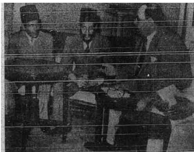
Ketua-ketua Ikhwanul Muslimin yang terkemuka. Dari kiri :

Orang ramai sekarang masih tertanya-tanya adakah Ikhwanul Muslimin akan dapat bertenaga sebagaimana keadaannya sebelum dimansuhkan oleh kerajaan Mesir dahulu? Inilah suatu soal yang dinanti-nanti yang jawapannya bukan daripada perkataan tetapi terbukti dengan perbuatan. Pada masa yang lalu