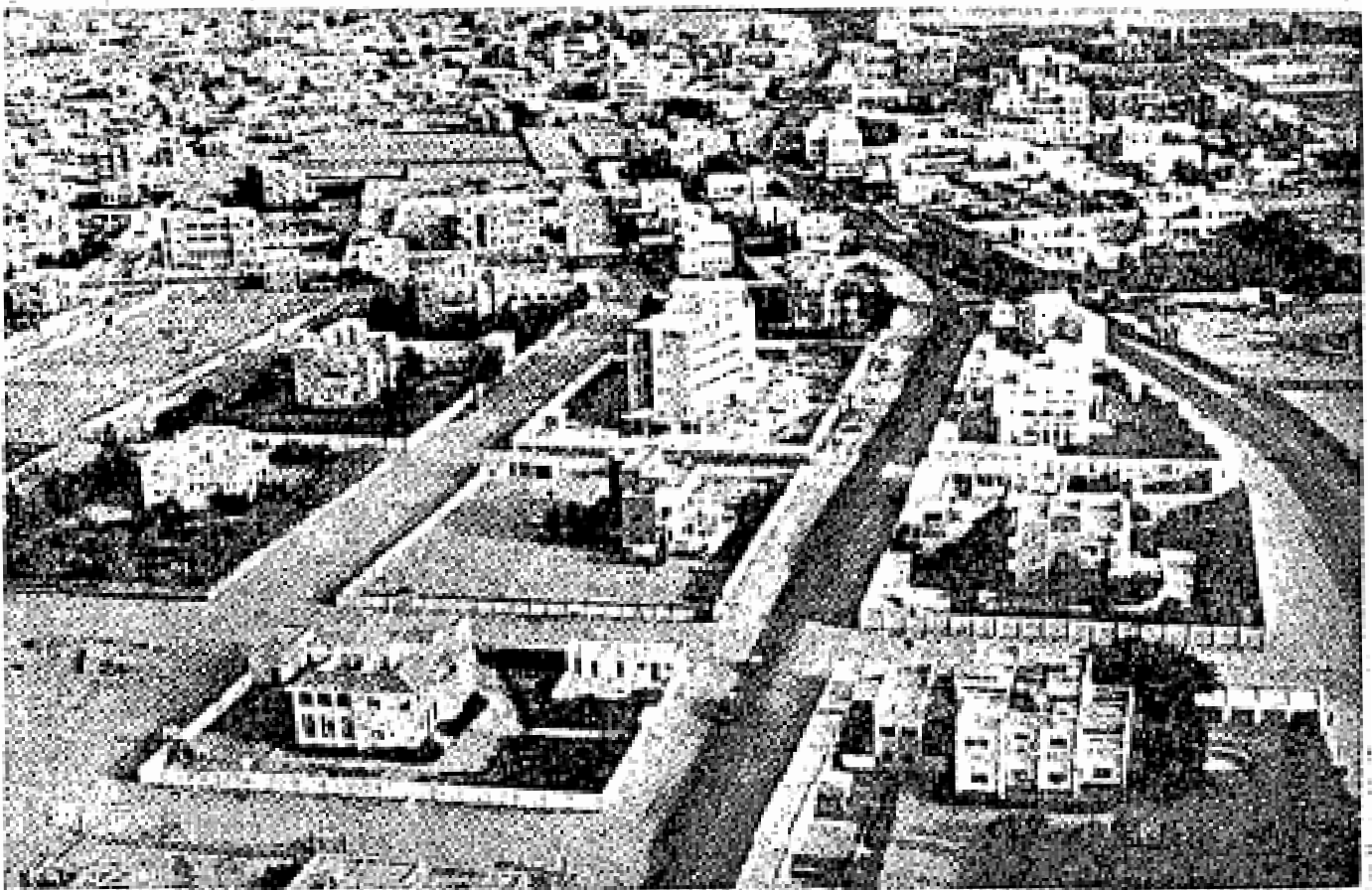
Suatu pemandangan di bandar Jeddah. Bandar pelabuhan ini menjadi tumpuan orang-orang ada tiap-tiap tahun.

Inilah dia rahmat yang telah dibawa oleh junjungan kita Muhammad Rasulullah ṣallā Allāh 'alayhi wa 'ālihi wa sallam , dan kerana inilah umat Islam diseluruh dunia hari ini merayakan hari keputeraan – Hari “mauludnya”, 'alayhi al-ṣalātu wa al-sallām .