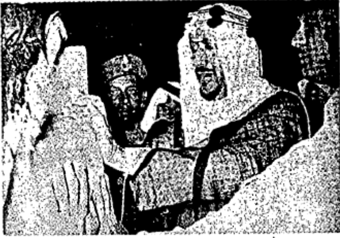
al-Malik Sa'ūd al-Mu'azzam

Negara Saudi Arabiah, yang mengandungi Tanah Suci Makkah al-Mukarramah dan Madinah al-Munawwarah, selain daripada al-Riyadh dan bandar pelabuhan Jeddah yang menjadi tumpuan orang-orang haji dari seluruh dunia pada tiap-tiap tahun, telah dibina dan diperindahkan dan telah mengalami kemajuan yang cemerlang dalam zaman pemerintahan al-Malik Sa'ūd al-Mu'azzam.