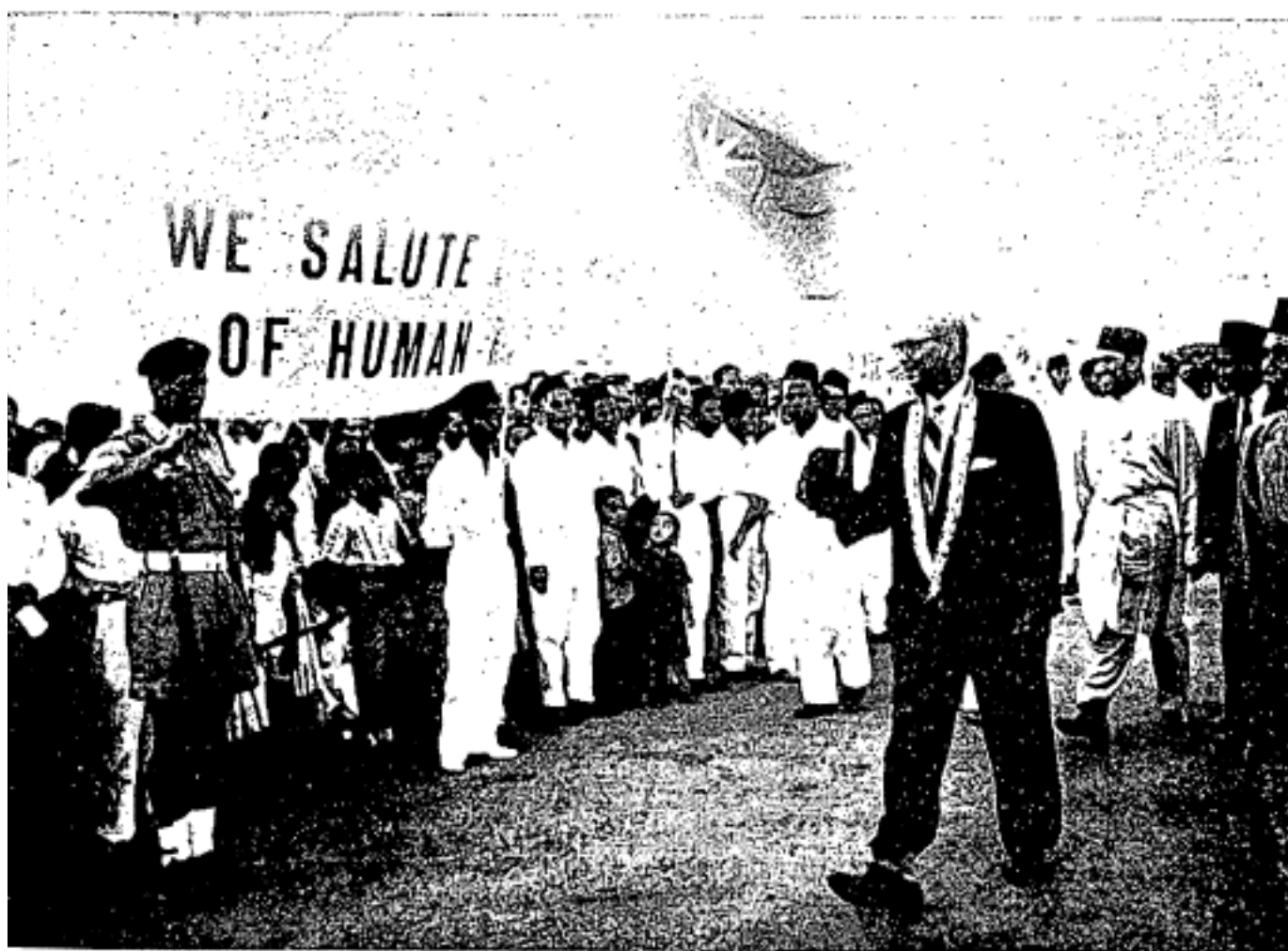
Perdana Menteri Persekutuan Tanah Melayu, Tunku Abdul Rahman Putra Al-Haj sedang disambut dengan meriahnya ketika beliau tiba dari London baharu-baharu ini.

Dipercayai keputusan yang diambil ini adalah satu keputusan yang bertolak ansur jika memandang bahawa tidaklah menjadi rahsia bahawa alim-ulama atau cerdik pandai agama di dalam Majlis itu telah pun tidak berpuas hati di dalam banyak bahagian di dalam Rang Undang-undang itu. Tidak mustahak dipersoalkan betapa dan bagaimana persoalannya diminta supaya disemak semula tetapi yang mustahak