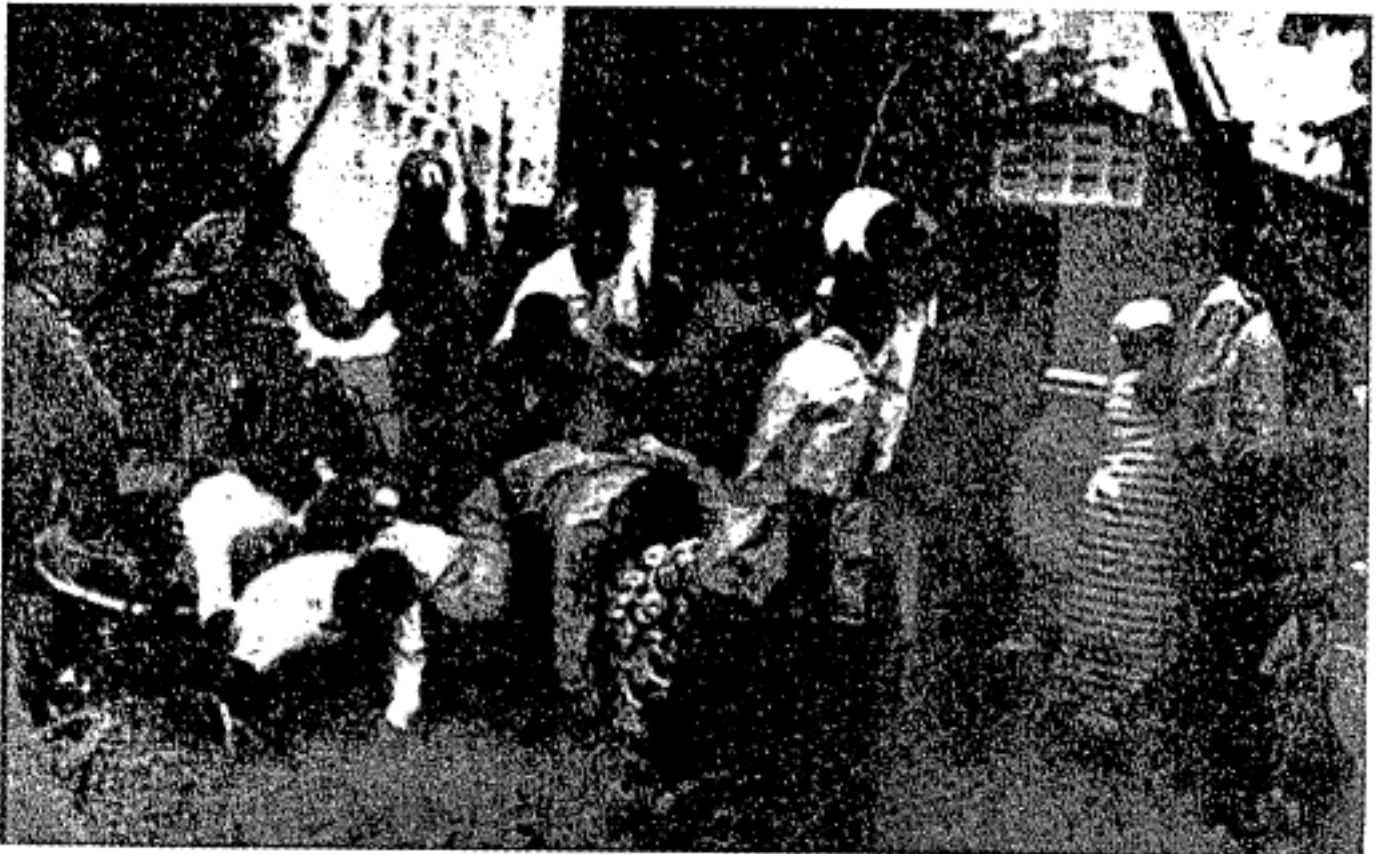
Congo sedang dibelasah dengan kejam oleh tentera boneka penjajah di Congo.

Pada mulanya negeri ini, setelah dijajah, telah dijadikan hak milik Raja Belgium. Dalam tahun 1908 Raja Belgium pula menyerahkan kepada negara