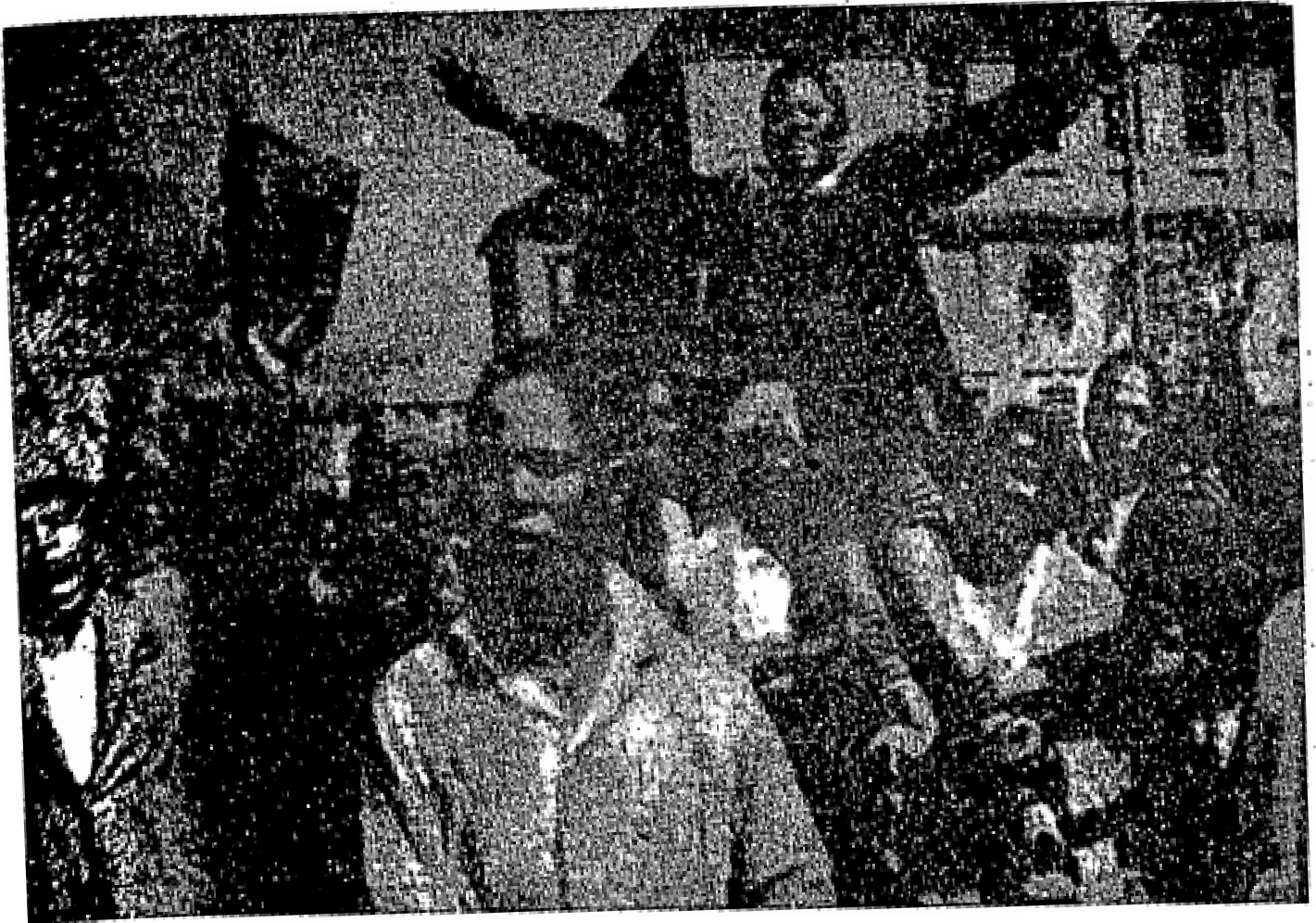
Rakyat Kenya sedang memperjuangkan kemerdekaan tanah air mereka dan menegakkan kedaulatannya.

Pada tahun 1885 telah memperdaya Sultan Zanzibar lalu menyewa daripadanya tanah daratannya yang terletak di seberang termasuk Pulau Mombasa.