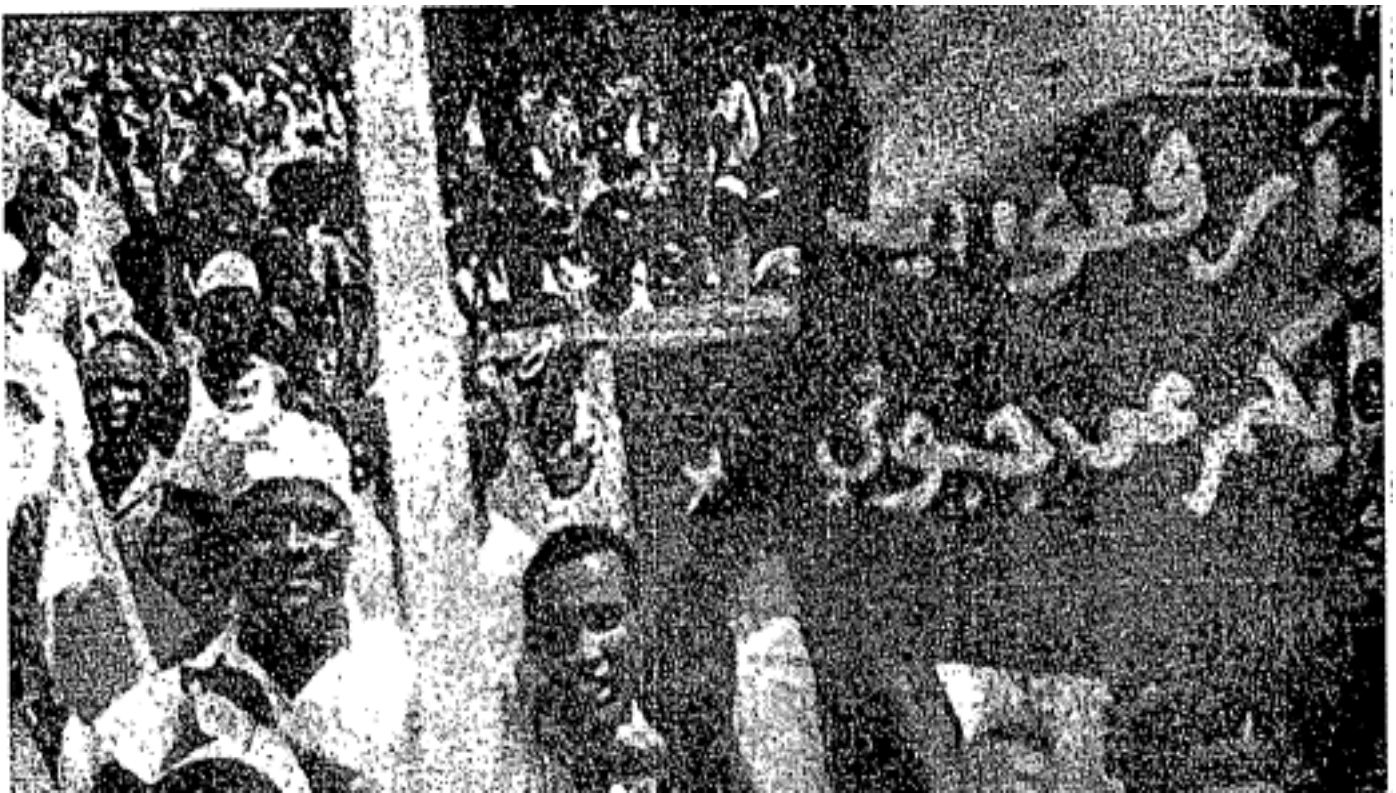
Rakyat negara Somal sedang memperjuangkan rancangan "Somal Raya" yang akan menyatupadukan kelima-lima daerah

Yang pertama: Negeri Somal bekas tanah jajahan