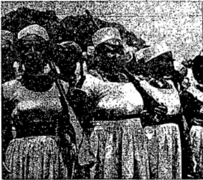
Pasukan tentera perempuan Tanganyika sedang berbaris.