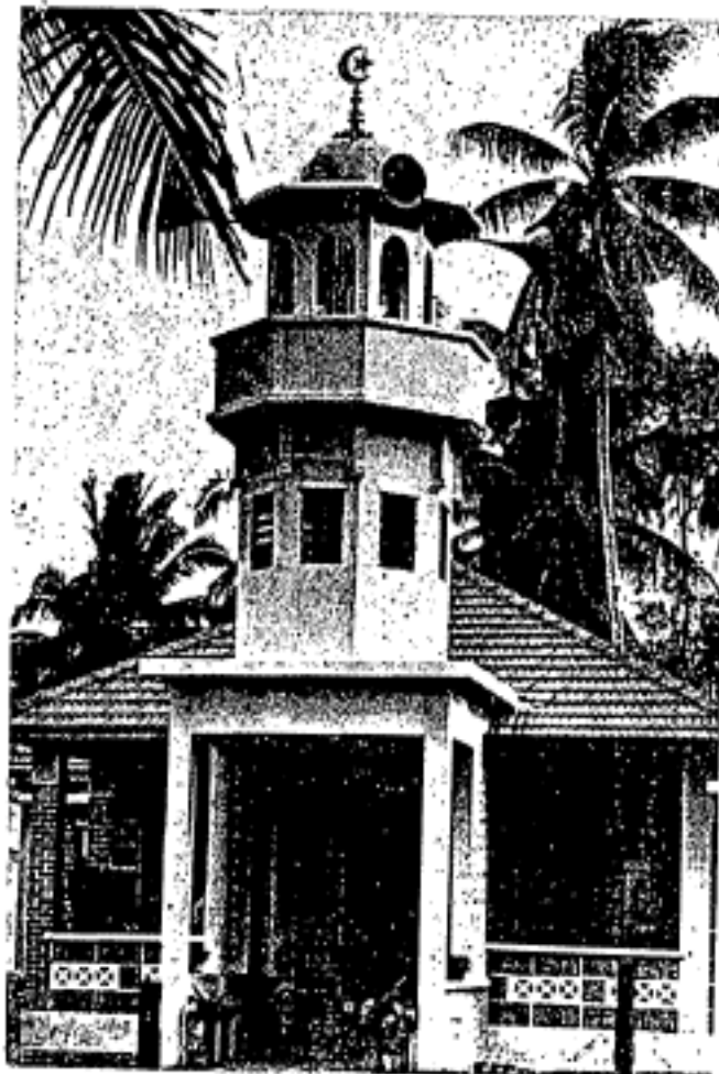
Salah sebuah masjid yang comel di tanah air.

Pendapat yang menghendaki supaya menunggu keputusan yang dirundingkan itu sebenar-benarnya menurut pendapat kita, hanya alasan untuk menegakkan benang basah jua. Persoalan loteri bukan baharu. Bertahun-tahun loteri berjalan dan untuk mengabui mata rakyat dengan tidak segan-segan ada pemimpin yang tidak mengerti duduknya persoalan hukumnya menepuk dada akan bersedia menanggung dosanya – iaitu