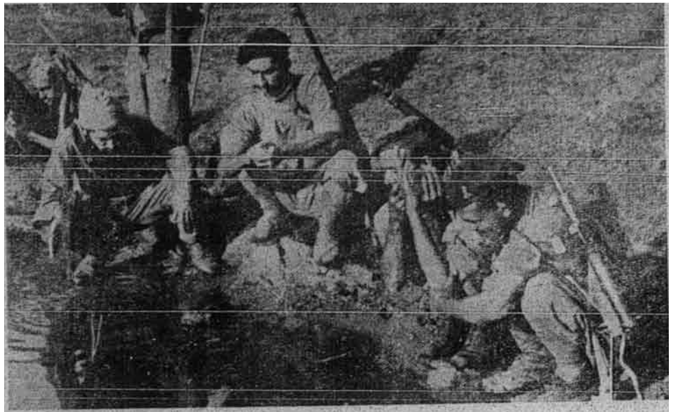
Mujahid-mujahid Pakistan yang mempertahankan Kashmir sedang mengambil wuduk kerana sembahyang.

yang besar yang telah berlaku atas kecabulan dari segala lunas keadilan dan akhlak berkaitan bangsa-bangsa. Oleh itu sangat-sangatlah mustahak bagi umat Malaya, khasnya orang-orang Islam, mengetahui dan mengerti akan perkara-perkara yang bersabit dalam perbalahan ini dan mengangkat suara mereka menyokong puak yang telah mengasaskan perjalanannya mengikut semangat Piagam Atlantik dan menggunakan segala kesabaran yang dapat dijalankan kerana tujuan keamanan dunia.