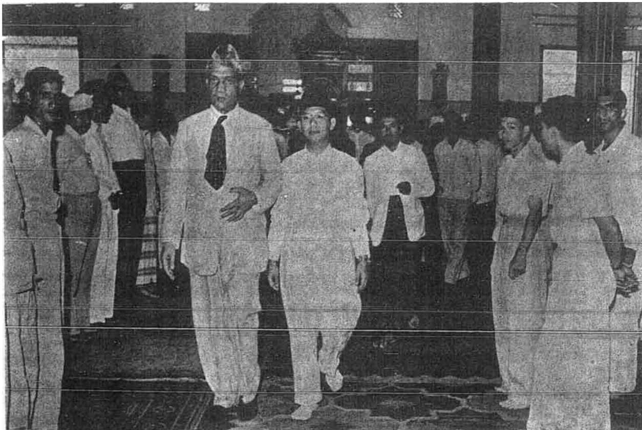
Duta Pakistan di Jakarta (kiri) bersama-sama dengan Kiyai Wahid Hasyim Menteri Agama telah masuk dalam Masjid Tanah Abang kerana sembahyang ghaib dan memperingati kehilangan yang menyedihkan itu.

Perdana Menteri Pakistan yang terkenal dan dikasihi.