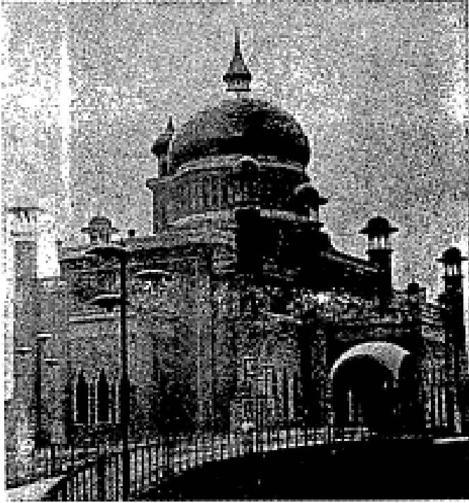
((Masjid Omar Ali Saifuddin)) Brunei tersergam

dengan hebatnya. Bawah: Gambar lampu besar dalam masjid ini