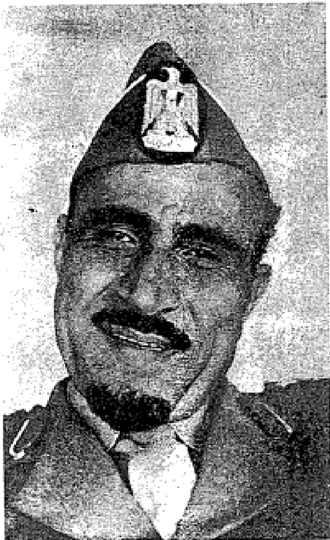
Abdullah Sallal ketua pemberontak Yaman.

Pada permulaan pertempuran Imam Muhammad al-Badr dikatakan telah tewas terbunuh, tetapi kemudiannya didapati ia masih hidup. Dalam masa ia menjadi putera mahkota Yaman (tahun 1959) baginda adalah penyokong yang kuat ke atas dasar Gamal Abdel Nasser dari Mesir. Ini terjadi dalam masa imam Ahmad Nasir li-Dinullah berubab di Itali.