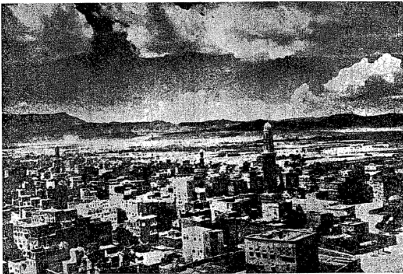
Bandar Ṣan’ā ibu negeri Yaman. Penduduk bandar ini sebanyak 60,000 orang.