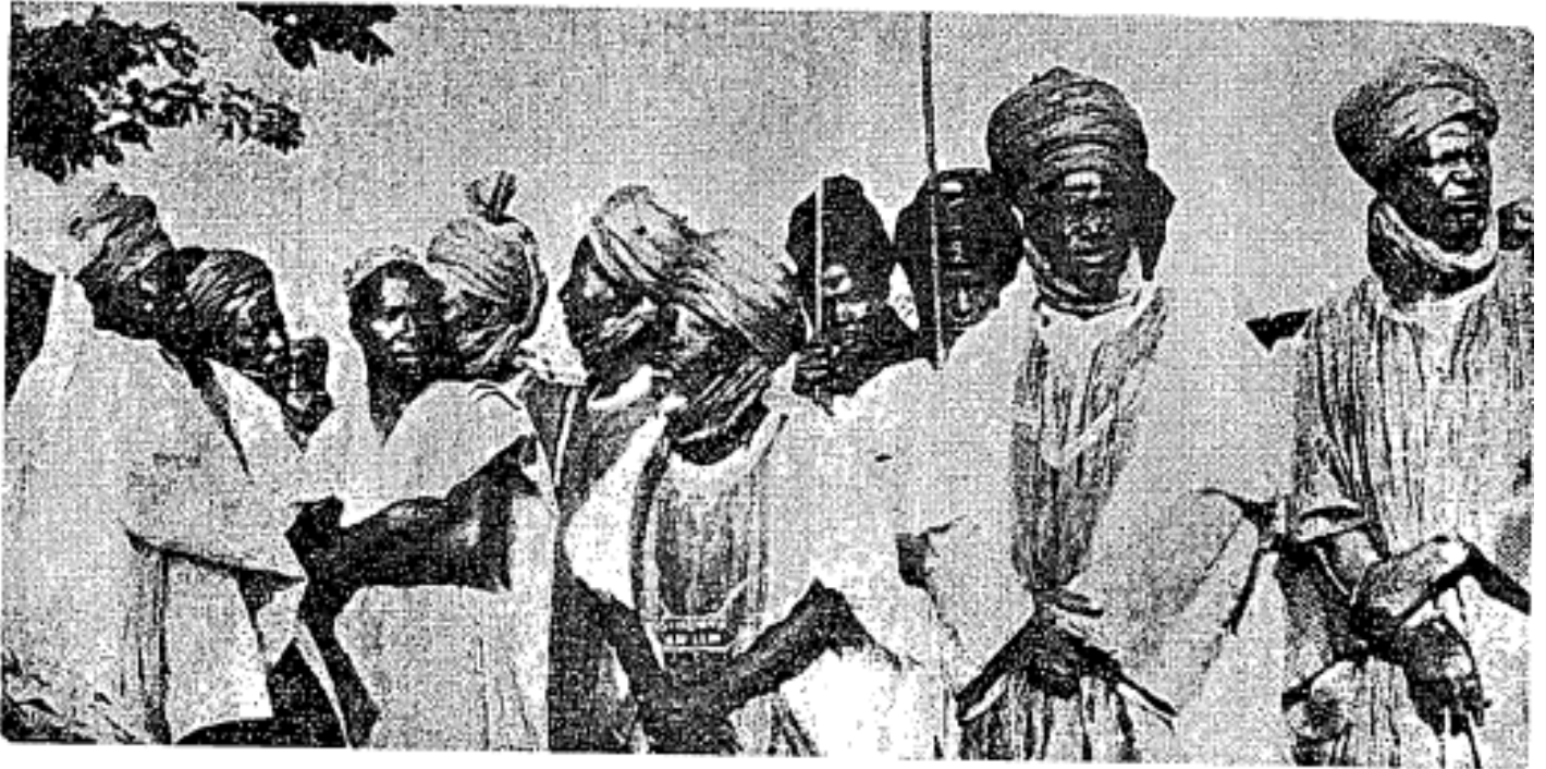
Orang-orang terkemuka Nigeria sedang berhimpun dalam suatu perayaan Mawlid al-Nabawī sharīf.