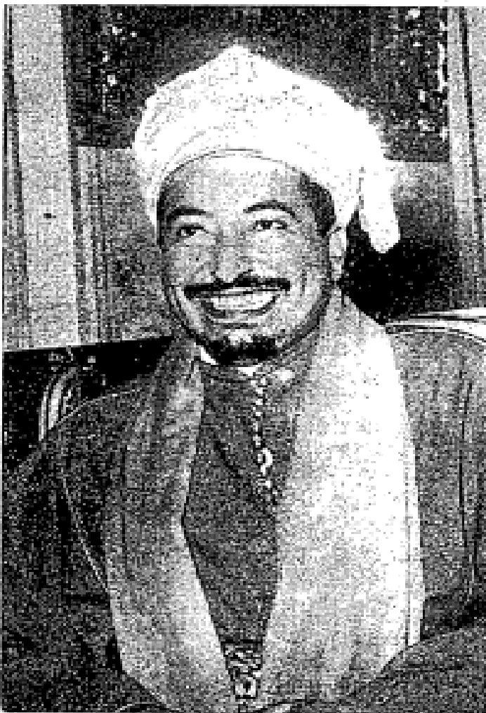
al-Imam al-Mansur Billah Muhammad al-Badr, raja Yaman.

al-Mansur Billah Muhammad al-Badr. Imam al-Badr inilah yang memerintah hingga sekarang ini.