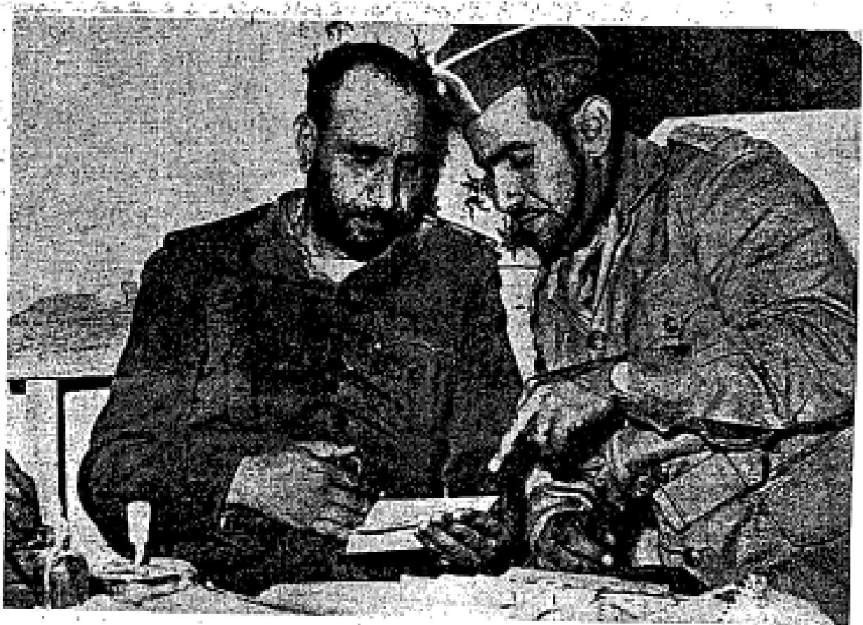
Abdullah Sallal (kiri) sedang berada di pejabat besarnya bersama dengan pembantunya sedang memeriksa telegram-telegram penyokongnya.

di dalam riwayat al-Qur’ān. Demikian juga di tanah Yaman ini terletak negeri Saba’ yang diperintah oleh Permaisuri Puteri Balqis dalam masa Nabī Sulaiman ‘alayhi al-salām .