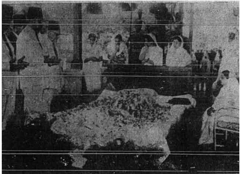
Jenazah Almarhum Liaquat Ali Khan dihadapi oleh Begum Liaquat Ali Khan tatkala dikafankan sedang menteri utusan Surya sedang menadah tangan mendoakan almarhum itu – gambar khas dari Pakistan.

Dengan tidak merendahkan keteguhan Islam di Jawa Barat, kita usulkan supaya beliau dibawa melawat ke Sumatera. sebab Jawa Barat belum aman. Di Sumatera pada umumnya, akan beliau melihat bagaimana kesetiaan rakyat kepada pimpinan dan negara dengan