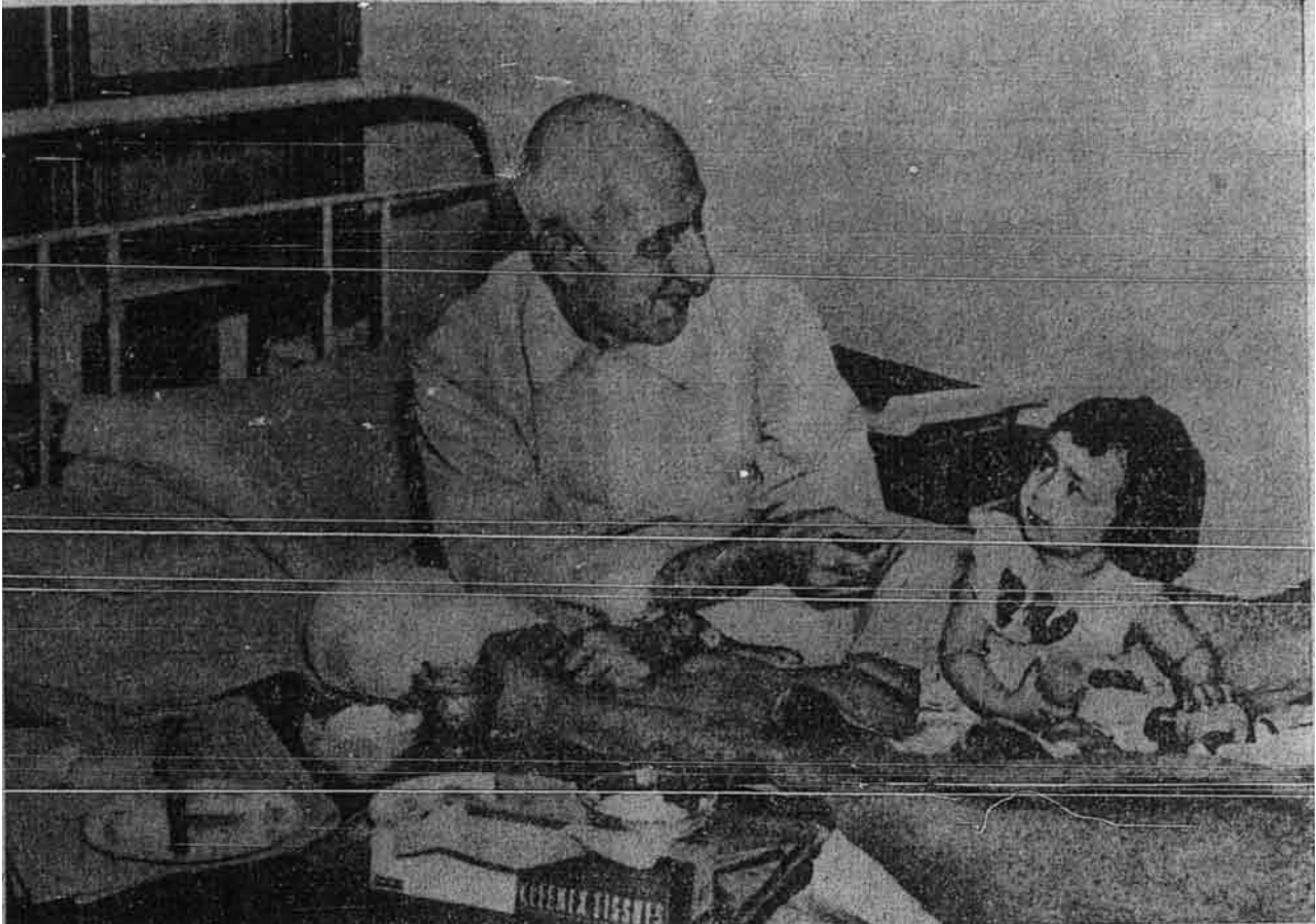
Perdana Menteri Iran Mohammad Mosaddegh bersama-sama dengan kanak-kanak daripada keluarganya sedang menawarkan kanak-kanak itu makanan yang dimakannya di tempat tidurnya. Sekalipun sentiasa di tempat tidurnya kerana sakit tetapi umat Iran menumpahkan kepercayaan yang penuh kepadanya untuk menyelesaikan masalah mereka yang yang sulit yang terbit daripada usaha menjadikan minyak Iran itu hak kebangsaan yang telah menggemparkan dunia.

-----*-----*-----*-----*-----*-----*-----