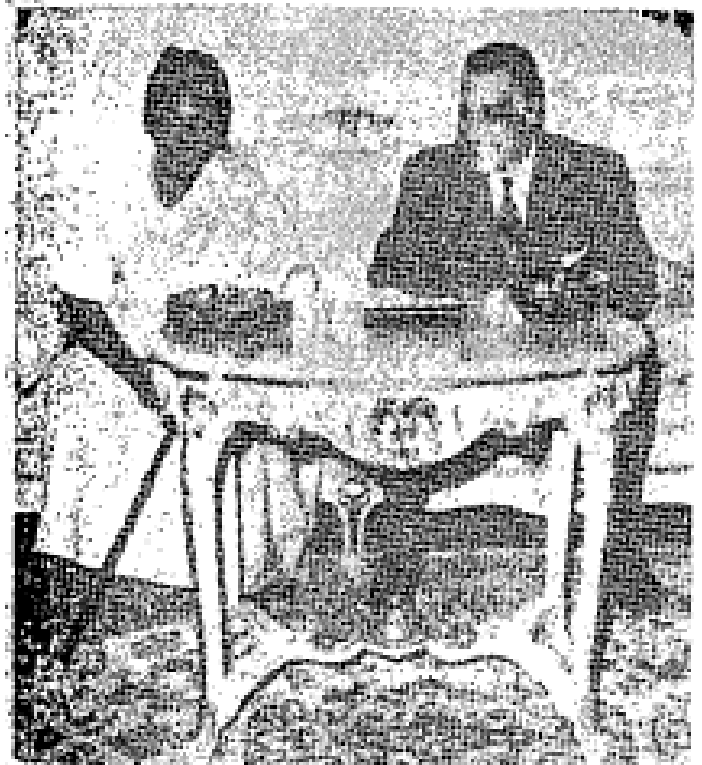
Tuan Rashid Kawada 3 Timbalan Presiden “Republik Tanganyika” bergambar dengan Presiden Gamal Abdel Nasser, sewaktu beliau mengunjungi Republik Arab Bersatu untuk mengeratkan perhubungan kedua negeri tersebut.

berlaku perkelahian itu segera memberi pertolongan, bila orang tua itu didapatinya masih hidup segera dibawanya mereka ke rumahnya dan diberikan rawatan-rawatan yang sepatutnya. Orang tua kaya itu tahulah ia bagaimanapun baiknya hati jirannya itu anak-beranak, kerana itu tak cukup ia menyebutkan terima kasihnya kepada jirannya anak-beranak yang telah menolongnya di saat ia ditimpa kemalangan itu, malah dipanggilnya jirannya anak beranak itu mendekatinya untuk ia menerangkan sesuatu rahsia yang selama ini dipegang erat tiada seorang pun yang mengetahuinya.