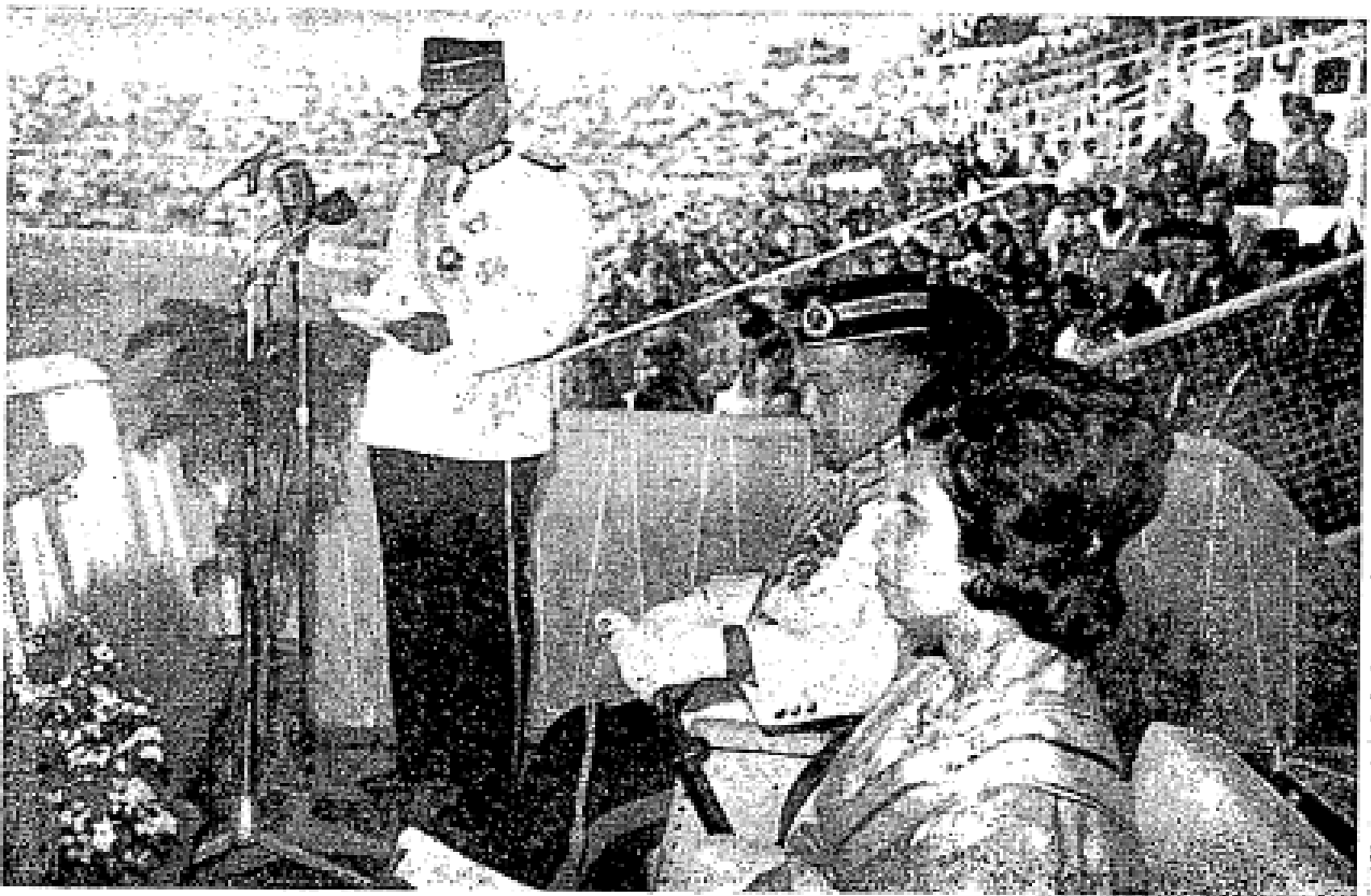
Yang Teramat Mulia Perdana Menteri Tengku Abdul Rahman Putra Al-Haj sedang memberi ucapan di Stadium Merdeka di dalam upacara Perisytiharan Malaysia baru-baru ini.

Kebanyakan pemuda-pemudi kita di hari ini memang boleh dikatakan mengaku beragama Islam semata-mata kerana mewarisinya dari ibu bapanya disebabkan ibu bapanya beragama Islam, mengenai pelajaran jauh panggang dari api. Padahal kita telah mengetahui jua Tuhan menurunkan al-Qur'ān asas agama Islam bukan tertentu kepada kaum alim ulama, ustaz-ustaz, pak lebai, dan cerdik pandai bahkan meliputi kepada sekalian orang yang mengaku beragama Islam waima Islam keturunan atau Islam tulen, kalau mengikut pengertian yang