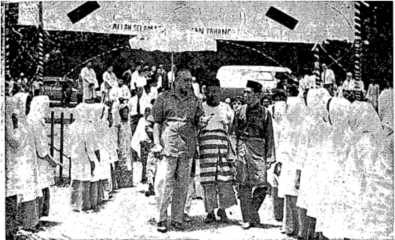
Sultan Pahang sedang dialu-alukan kedatangannya oleh penuntut-penuntut perempuan Madrasah Dong, Raub, Pahang semasa baginda melawat ke madrasah tersebut tidak berapa dulu.

akan pelajaran-pelajaran agama yang dipeluknya. Sewajibnya Yang Teramat Mulia Tengku memandang bahawa perkara mengadakan kitab-kitab agama yang luas mestilah terlaksana dengan seberapa cepat yang mungkin di dalam kita menghadapi perkembangan Kristian yang semakin membesar di tanah air kita ini. Yang Teramat Mulia Tengku hendaklah menggalakkan penerbitan-penerbitan agama kepada jalan ini memberi bantuan-bantuan supaya Islam tersebar dengan jati dan luasnya kepada umat Islam dan percayalah bahawa jalan ini akan menjadi kenangan sepanjang masa dan in shā'a Allāh Tuhan akan memberkati ini sekiranya Yang Teramat Mulia Tengku melaksanakannya.