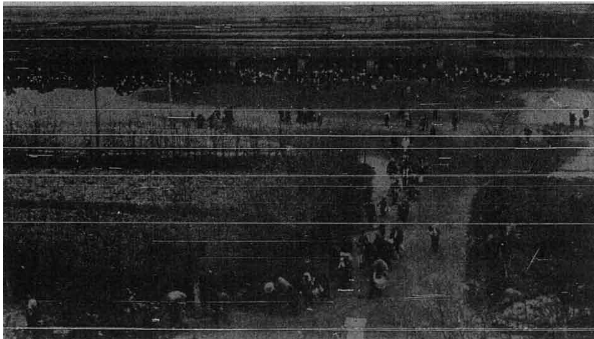
Gambar: Orang-orang Islam sedang disambut oleh orang-orang Turki di Ederne setelah keluarnya dari sempadan Bulgaria – gambar-gambar USIS.