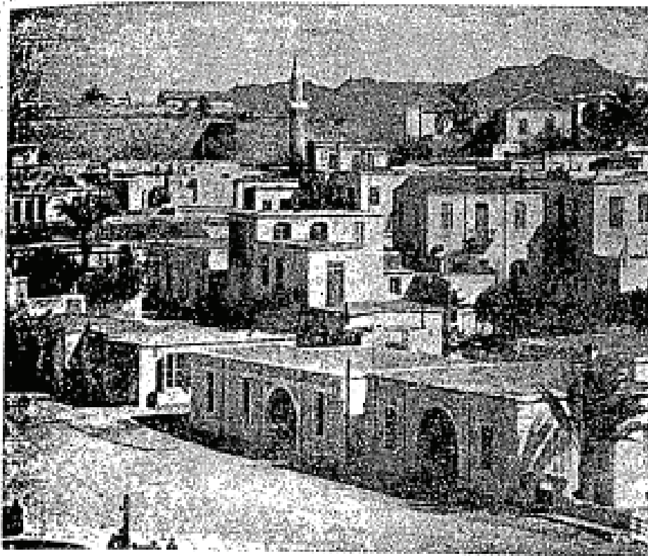
Suatu pemandangan di Kyrenia, Cyprus.

Langkah-langkah Greek mencampuri soal Pulau Cyprus itu wajib ditahan apalagi langkah-langkah itu mengeluarkan perikemanusiaan dengan memperkosa penduduk orang-orang Turki Islam yang telah tinggal di sana hampir-hampir lima kurun lamanya. Perkosaan-perkosaan yang hebat dilakukan kepada mereka yang tidak bersenjata itu sebagai balasan dendam kepada orang-orang Turki yang telah pernah “menghalau” mereka sehingga terjun ke laut di Selat Dardanelles. Perbuatan-perbuatan kejam yang dilakukan oleh Greek, jika tidak ditahan adalah satu perkosaan yang besar kepada umat Islam; dan kerana itulah kerajaan Turki campur tangan. Untuk menahan keganasan dan sebagai peringatan akhirnya kerajaan Turki terpaksa menghantarkan sepasukan angkatan lautnya sebagai peringatan bahawa umat Turki berdiri