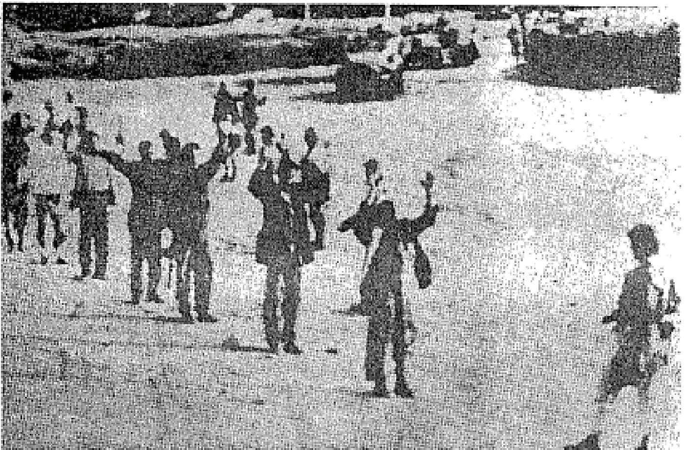
Tentera-tentera darat Israel dengan mengangkat tangan menyerah diri kepada tentera-tentera Mesir di dalam suatu pertempuran sengit di kawasan Sinai.