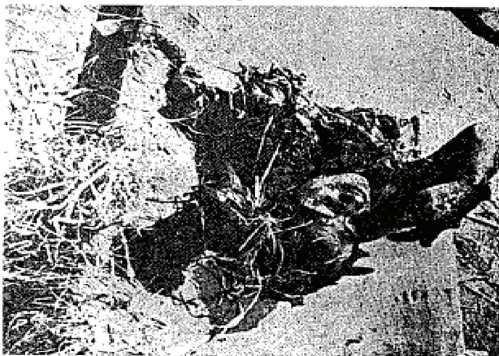
Rakyat jelata yang tidak bersenjata dibunuh secara kejam.