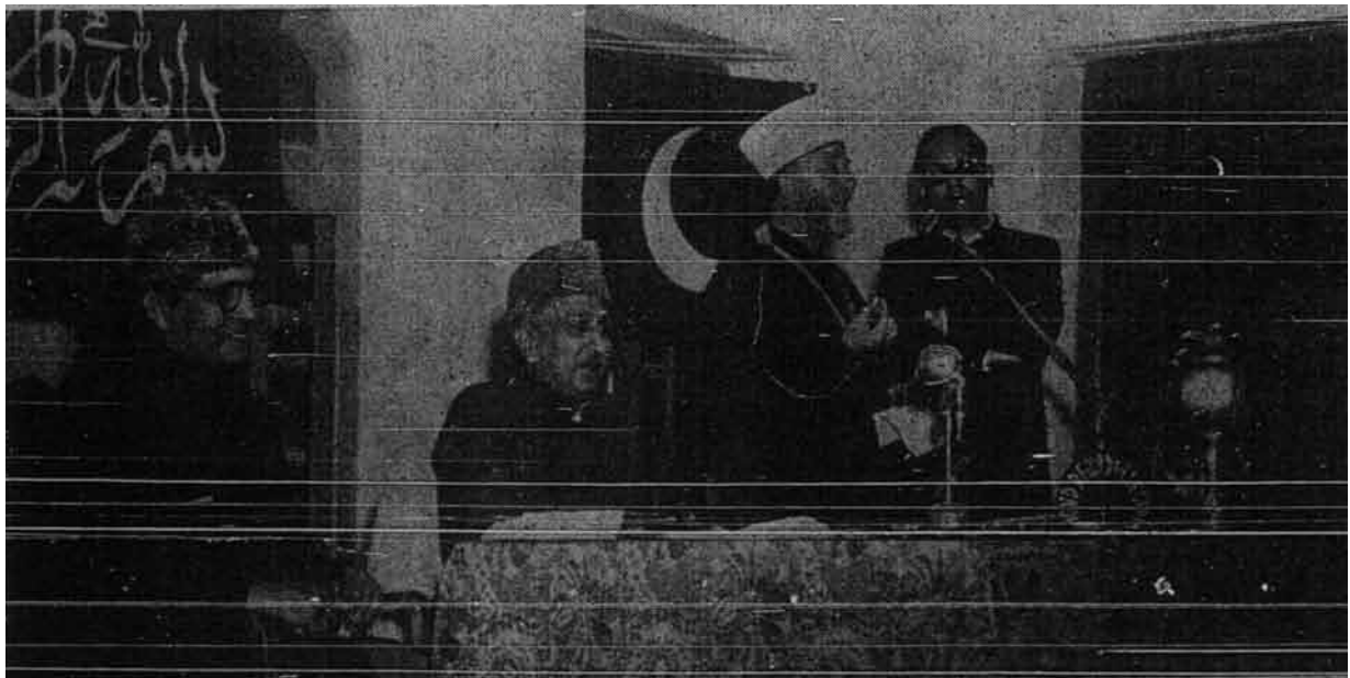
Sebuah Kolej Arab yang Modern telah dibuka di Karachi pada 12 Mac 1952. Kolej itu dibuka oleh Mujahid yang besar Sahibul Somahah al-Haj Amin al-Husaini Mufti Palestin. Ia sedang memberi ucapan pembukaannya di majlis itu.