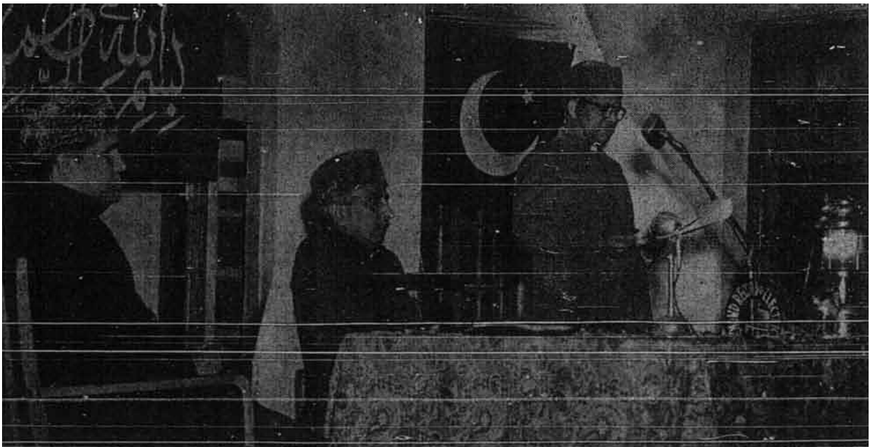
Tuan Fazlur Rahman, Menteri Pelajaran Pakistan sedang memberi ucapan atas pembukaan Kolej Arab Modern yang bakal merapatkan lagi perhubungan-perhubungan Negara-negara Islam sedunia- Gambar-gambar khas dari Pakistan.