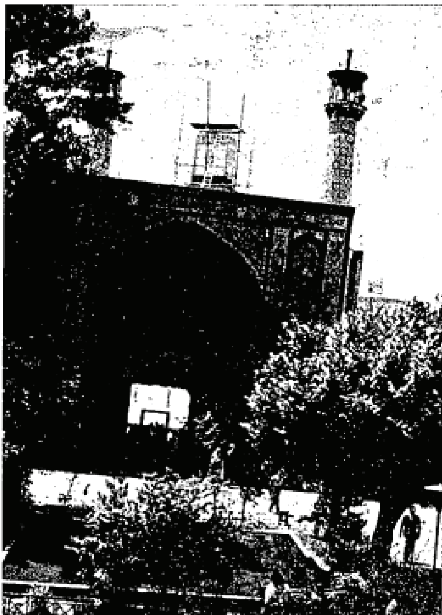
Bangunan Maktab Perguruan Tinggi di Tehran-Iran. Gambar diambil dari sebelah dalam. (Gambar Edrus Qalam).

Perhubungan: Ada 15,000 batu jalan-jalan raya dan lebih daripada 100,000 kereta di Iran. Trains Iranian Railway yang mempunyai landasan keretapi daripada utara ke selatan sejauh 900 batu sekarang telah disambungkan ke daerah-daerah lain. Dalam tahun 1957 dan 1958, dua landasan keretapi yang penting telah dibina, satu daripadanya (400 batu