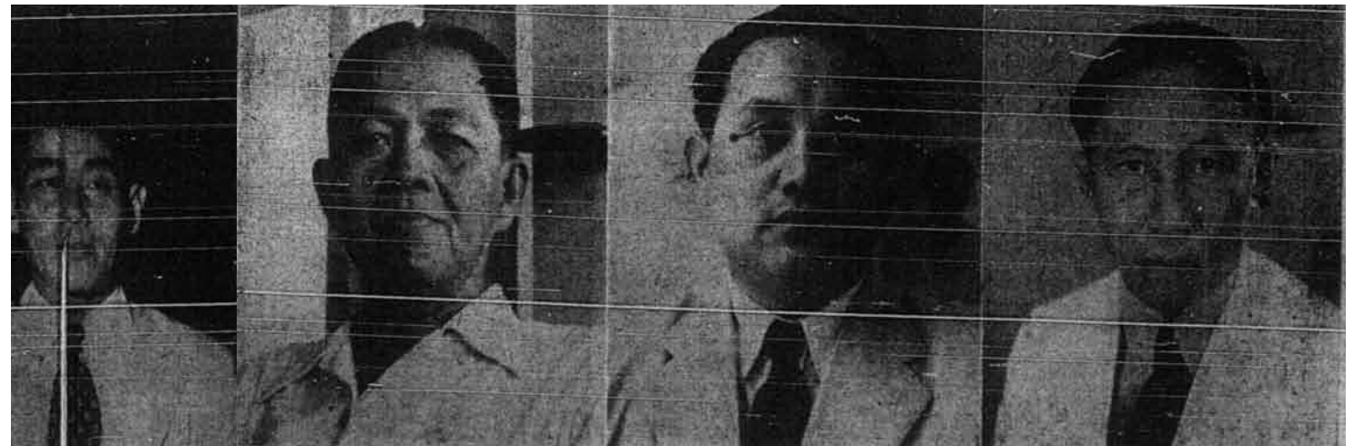
Arnold Menonutu –Menteri Penerangan (Partai Nasional Indonesia)