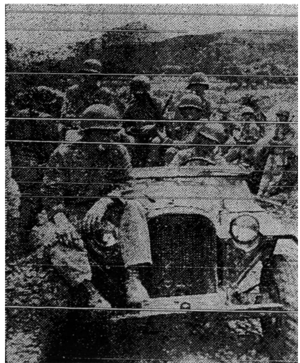
Askar-askar Amerika yang sedang mara di dalam medan perjuangan di Korea.

Kemudian pemerintah negeri Jepun dipegangnya dengan setengah-setengah orang memandangnya sebagai pemerintahan diktator tatkala