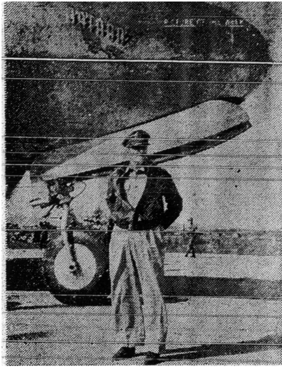
Jeneral Douglas MacArthur di hadapan sebuah kapal terbang yang bernama Batan sedang melawat medan peperangan Korea dengan kapal terbang itu juga dahulu ia datang dari Philipine ke Jepun.