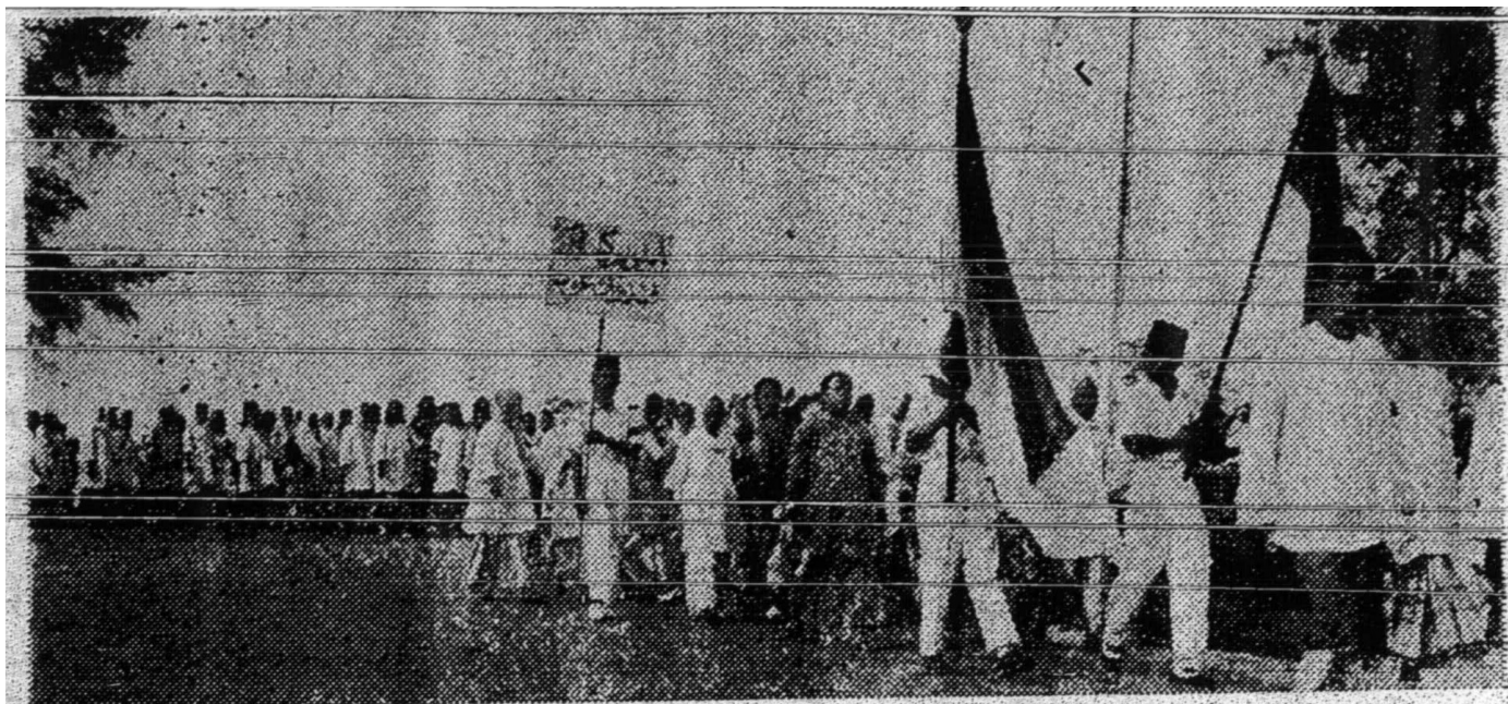
Gambar kaum ibu Johor bergembira dan bersuka cita beramai-ramai berarak dengan dihulurkan oleh lelaki meminta Onn balik menjadi yang di-Pertua UMNO apakah tanggungan lelaki ke atas perempuan? Kelak akan dibahas juga oleh penulis rencana ini.

Islam yang ditaja bukannya oleh hukum akal manusia tetapi tajaan daripada Allah Subhanahu wa Taala yang mengetahui selok belok keadaan hambanya.