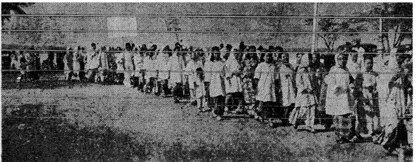
Kaum ibu Johor Baharu sedang berarak kerana Dato' Onn yang telah meletakkan jawatannya sebagai yang Di-Pertua Agung UMNO supaya memegang semula jawatannya yang diadakan tidak berapa lama dahulu. Apakah kata agama Islam di dalam cara perempuan

Hal yang demikian ini tidak bermakna bahawa kanak-kanak perempuan itu hilang haknya dengan mengkahwinkan dirinya. Dengan sebab inilah barangkali Imam Malik membahagikan syarat perkahwinan untuk meluaskan hak itu kepada dua bahagian dengan katanya: "Perempuan golongan rendah boleh mengkawinkan dirinya sendiri tetapi yang demikian itu tak boleh bagi perempuan daripada golongan orang yang terhormat. Daripada perkataan