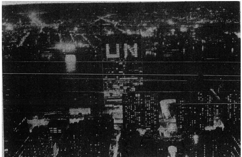
'UN' bangunan sekreteriat Bangsa-bangsa Bersatu, letaknya di Tebing sungai Timur, New York.

Pengembara-pengembara yang suka hendak mengetahui bagaimana bandar ini telah maju menjadi besar akan dapat mengetahui halnya dengan cukup dalam beberapa banyak buku dan makalah-makalah yang telah ditulis oleh orang-orang yang ahli, dan oleh pengarang-pengarang