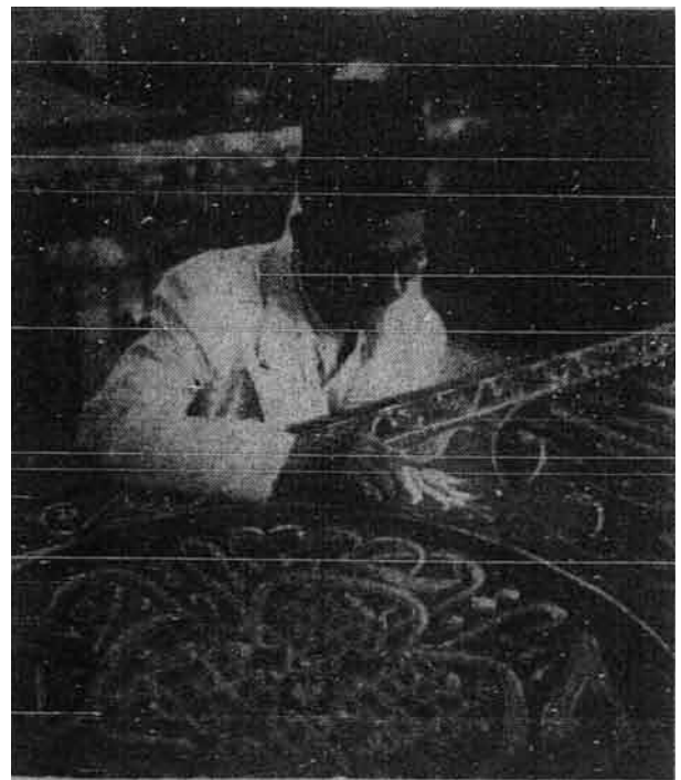
Seorang pekerja yang mahir sedang menekat dengan tekunnya.

Pemisahan gereja daripada negara adalah sesuai dengan ajaran Kristian yang hanya semata-mata memimpin rohani dan ibadat. Dan dari permulaannya peradaban dan kerohanian memang berasal dari dua pusat yang berlainan, iaitu kerajaan dan gereja. (bersambung)