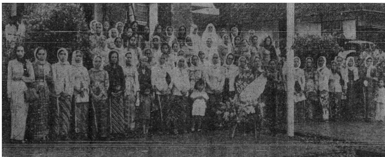
Persidangan utusan muslimat bagi Masyumi diambil tatkala mengadakan persidangan daripada utusan-utusannya di Sukabumi.

Menurut pendapat saya hal ini sememangnya benar kerana daripada apa yang kita pandang dan kita lihat bahawa banyak bencana-bencana yang telah terjadi daripada percampuran-percampuran yang tidak berhad daripada lelaki yang melanggar tegahan-tegahan Islam – yang demikian ini dan tidak akan disempadankan oleh lelaki atau perempuan walau sebagaimana tinggi pelajarannya