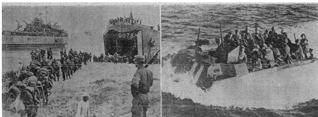
Dua gambar di atas ini menunjukkan pendaratan-endaratan tentera Amerika di Korea dengan menggunakan alat-alat kelengkapan yang baharu – Gambar-gambar AP.