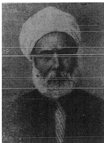
Almarhum Syekh Muhammad Abduh yang telah berjasa di dalam membangkitkan semangat Islam dengan meluaskan faham-faham gurunya As-Sayyid Jamaluddin al-Afghani.

hanya seketika sahaja lamanya kerana syak Shah itu kemudiannya timbul lagi. Dengan itu ia meminta izin pula hendak beralih angin keluar negeri tetapi permohonannya itu telah ditolak dengan kasar dan oleh