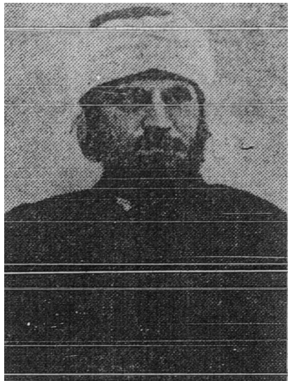
As-Sayyid Jamaluddin Al-Afghani

seorang Islam yang terkemuka dan sebagai seorang pembangun kepada roh-roh yang telah beku. Ia terkenal sebagai pembangun kepada semangat umat Mesir sekarang ini.