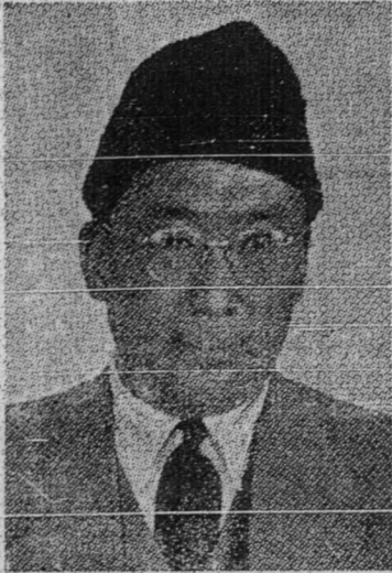
توان حاج جلال الدين واغ كين شن کتوا فرو کيلن دري چنا