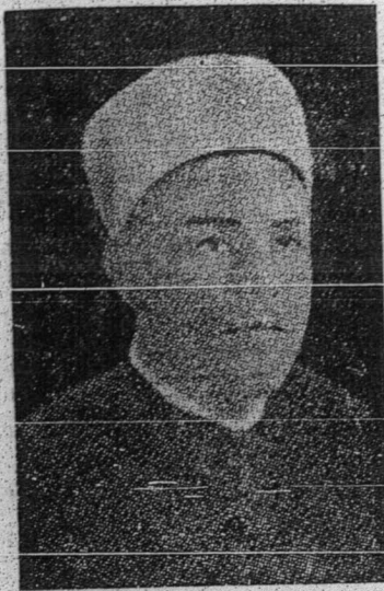
دقتور مصطفی السبائي

„جان دهدافن توان ۲ اداله فنوه دغن دوری. هالغن ۲ منوغکو دهدافن توان ۲ اکن جاتره فد تيف ۲ لئکه یغ توان ۲ جانکن. کاکي توان ۲ اکن برداره افيل اي تله ترکنا اکن هالغن ۲ ايت تافى سوات یغسا یغملیا لیه سوک منومفهن دارهن کران هندق منیگیکن کجر ماتن“ - کات دقتور مصطفی السبائي کتوا فروکيلن سوریا ددالم موء تمر العالم الاسلامي ددالم اوچافن یغ ساغه مناریق وکیل ۲ دان فلاوة ۲ موء تمر ایت فد 10 فیبرواری 1951 یهداکن دکاراجي.