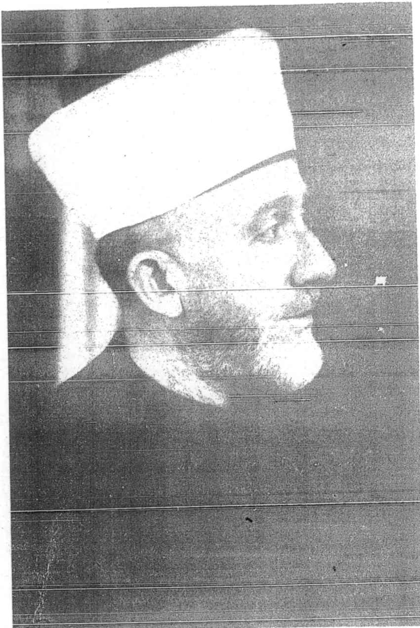
صاحب السماحة الحاج امين الحسيني